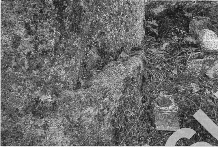
Рис. 2. Ниша на передней стороне Стёп-камня, куда ещё в XIX – XX века клали хлеб и ягоды

пайдзём у паземкі і тады ахвяру ягад сыпем каля гэтага каменя, каля Куліны... Гэта нам ужо кажуць, што ахвяркі кладзіце [1, LTR 7647/610]. Оказывается, что ягоды Степану сыпались на своеобразный порог впереди камня, внизу, на левой стороне (рис. 2).