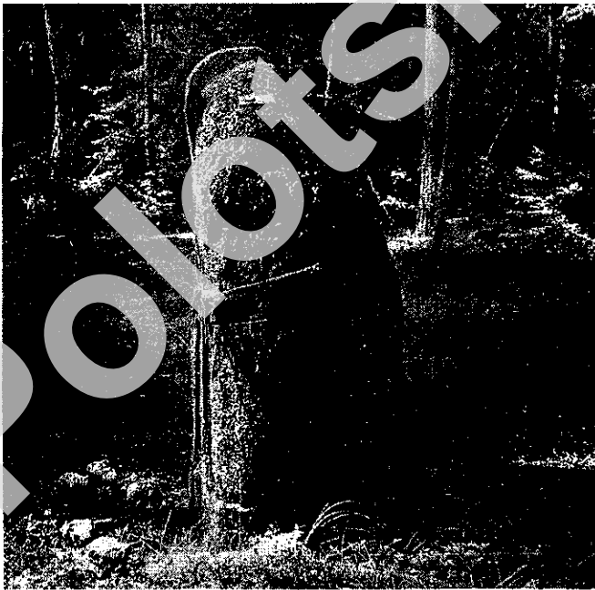
Рис. 1. Степ-камень (фото автора 2004 г.)

В центре большинства преданий о возникновении реки – Степ-камень (в вариантах – просто Степан), представленный на рисунке 1. Вместе с ним предания и исследователи также упоминают по соседству растущую священную сосну Кулину (иногда – Акулину). В большинстве вариантов Кулина на сегодняшний день уже занимает место жены Степана Вельяны.