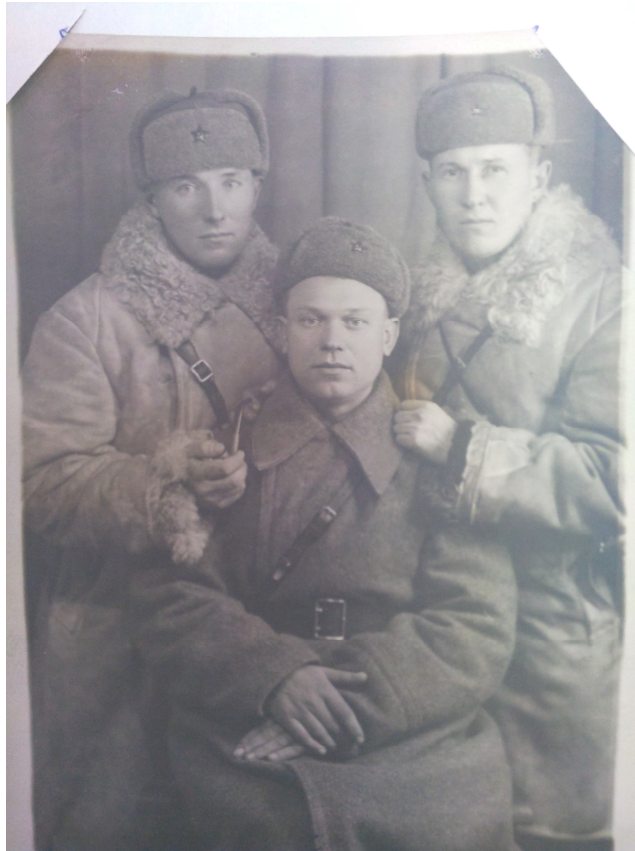
Група бойцов в/ч 9903

После разгрома фашистских войск под Москвой войсковая часть приступила к подготовке групп действия в глубоком тылу противника в Белоруссии, Латвии, Польше, Восточной Пруссии. Спрогис лично проверял готовность каждой группы, уходящей в тыл врага. Важные и опасные операции возглавлял сам. Приходилось переходить линию фронта под миномётным и пулемётным огнем, ползти по заминированным полям. С марта 1942 г. группы доставлялись на самолетах в заданный район и десантировались. Основная их задача – стать базой партизанского движения на местах и установить связь с Центральным штабом партизанского движения. В местах действий они пополнялись за счет местного населения [7, с. 18–19].