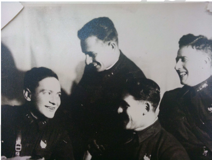
Возвращение в часть