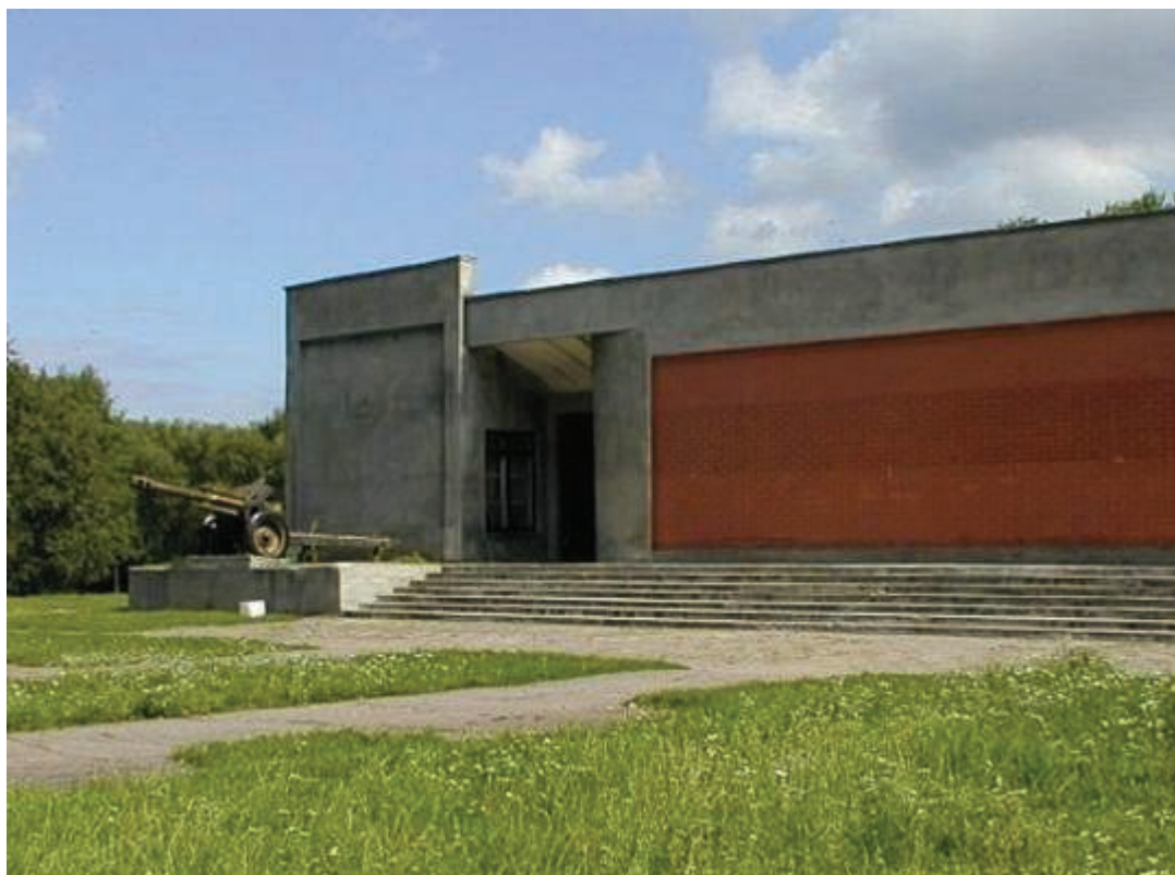
Рисунок 14. Площадь Свободы