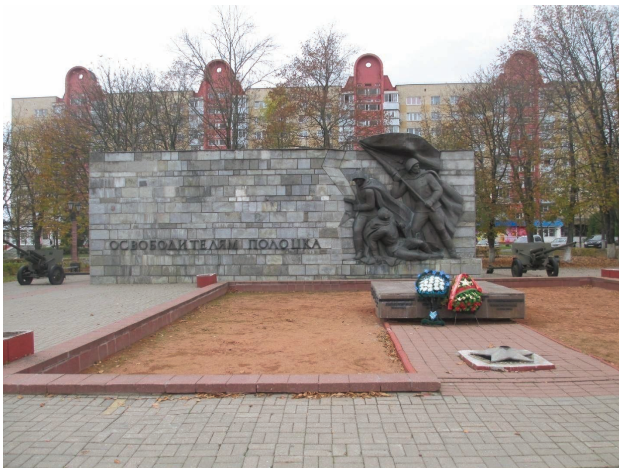
Рисунок 1. Памятник Освободителям г. Полоцка