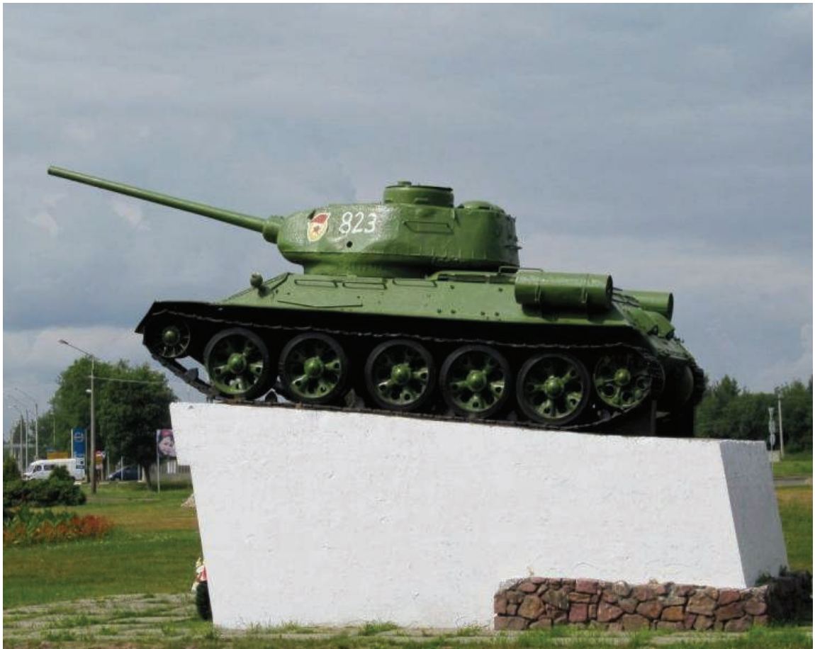
Рисунок 12. Обелиск в честь 1-го Прибалтийского фронта И.Х. Баграмяна (фото автора)