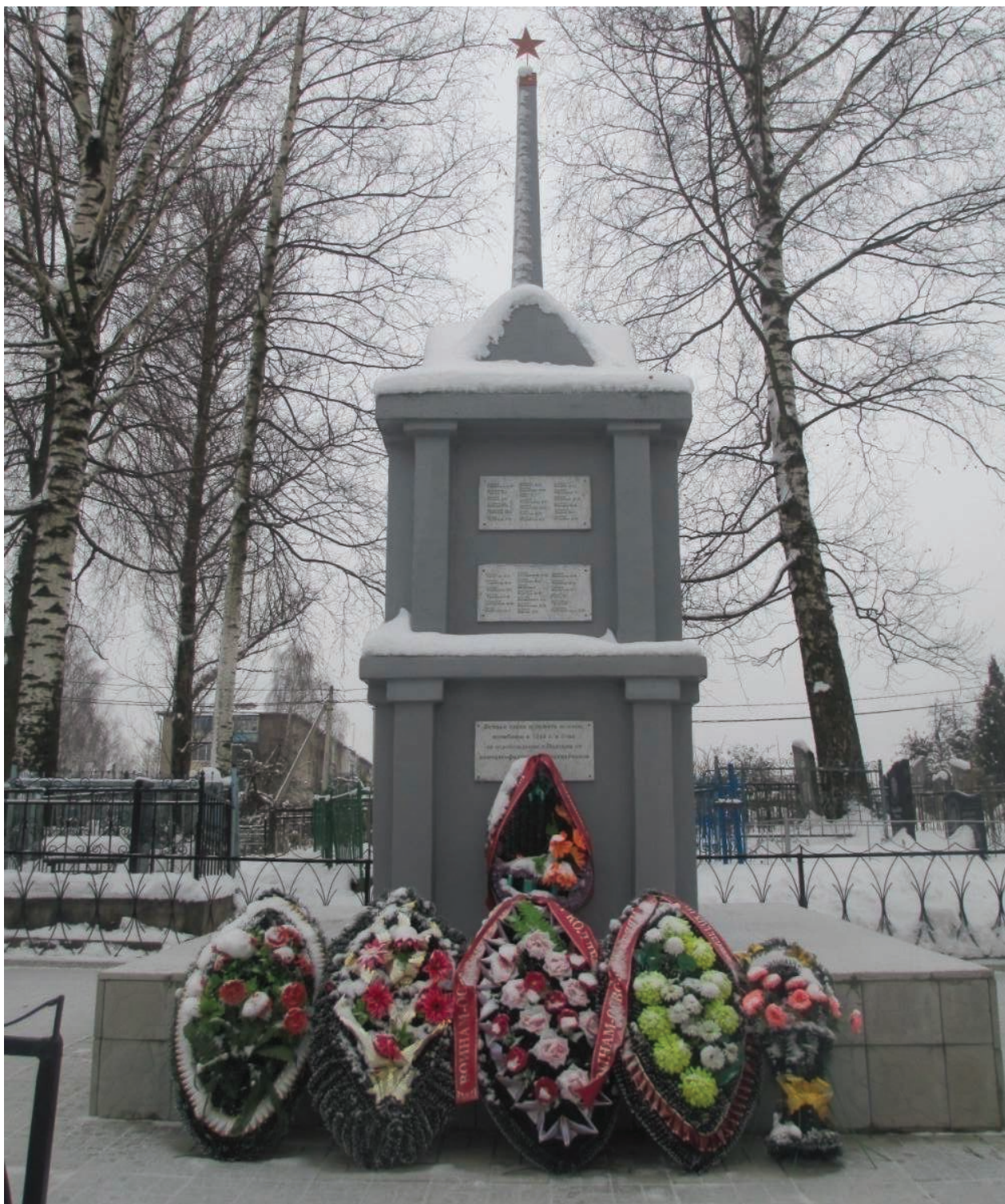
Рисунок 2. Памятник на братской могиле, Фатыновское кладбище