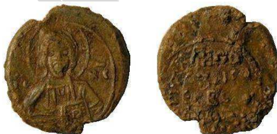
Рис. 3. Евфросиньевский молиन्दул, найденный в 2010 г., где то в Беларуси, по И.А. Жукову