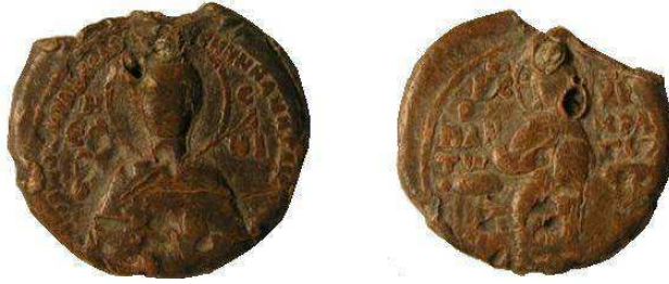
Рис. 4. Евфросиньевский молиндовул, найденный в 2012 около гп. Березна, по И.А. Жукову

родских князей, и, следовательно, эти буллы скрепляли послания, предназначенные новгородскому князю» [4, с. 24].