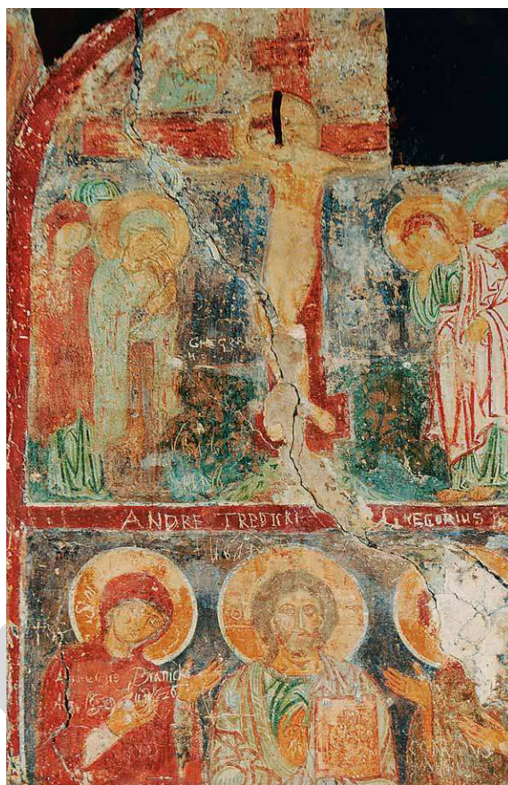
Рис. 4. Росписи кельи Евфросинии Полоцкой.

Почитание Всемилоственного Спаса нашло отражение также в сохранившихся до наших дней памятниках искусства Владимиро-Суздальской Руси. 22 Следы этого культа известны и в Великом Новгороде, начиная с середины XII в. 23