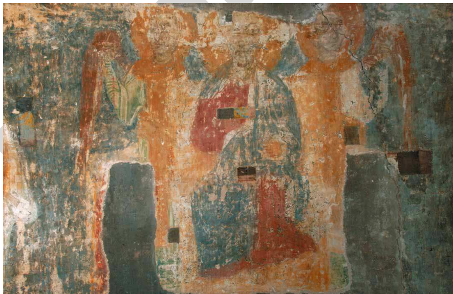
Рис. 6. Христос Архиерей. Росписи Спасской церкви Евфросиниевского монастыря. XII в.

Почти одновременно в разных концах Руси – в Полоцке и во Владимире-на-Клязьме – были воздвигнуты два каменных храма, посвященные новому празднику. Помимо Спасской церкви Евфросиниевского монастыря Всемилостивому Спасу, по всей видимости, был посвящен построенный в 1164 г. на княжеском дворе во Владимире белокаменный храм, к сожалению, не уцелевший до нашего времени.