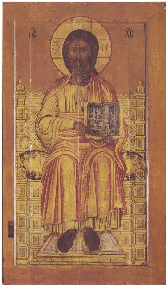
Рис. 8. Икона «Спас Златая риза». Успенский собор Московского кремля

нуила. 38 Возможно, в древности на Руси существовал еще один тип Мануилова Спаса, где перст Спасителя в учительном жесте был обращен к созерцателю иконы (рис. 9). 39