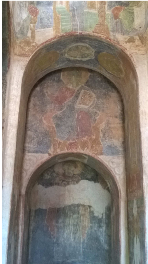
Рис. 5. Спас Пантократор. Росписи Спасской церкви Евфросиниевского монастыря. XII в.