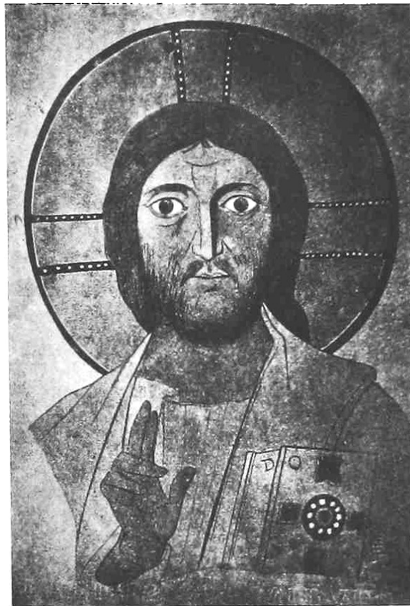
Рис. 7. Христос Пантократор. Катакомбы св. Понциана. VI – VII вв.

Дело в том, что положение правой руки Христа при трактовке его образа в рамках известной средневековой иконографии Вседержителя может быть различным. Уже в монументальных памятниках VI–VII вв. (росписи римских катакомб св. Генерозы, св. Понциана) Христос изображается в рост или поясно с Евангелием (раскрытым или закрытым) в левой руке и благословляющим жестом правой руки (рис. 7). 35 Данный тип является самым распространенным в иконографии Христа Пантократора вообще. 36