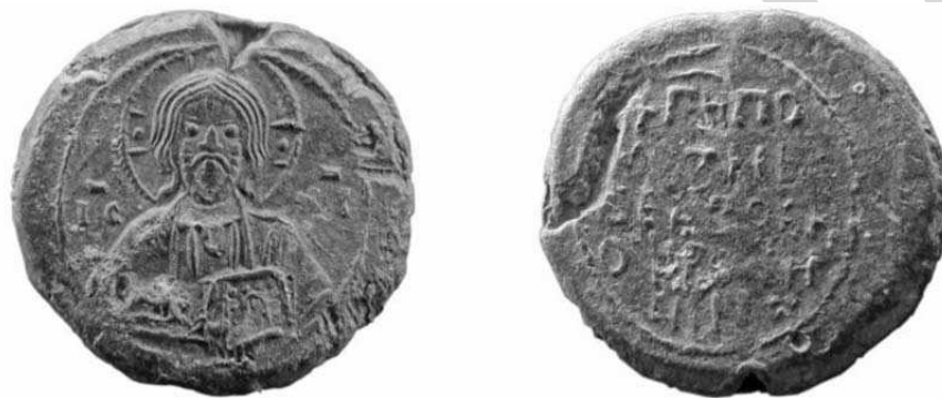
Рис. 1. Печать, найденная при раскопках в Полоцке в 2015 г.

В 2015 г. при раскопках, проводившихся в Спасо-Евфросиньевском монастыре в Полоцке с целью выявления конструктивных особенностей Спасо-Преображенской церкви XII в., была найдена хорошо сохранившаяся активная печать. Артефакт представляет собой тип вислой печати, изготовленной из свинца, диаметром около двух с половиной сантиметров, с сохранившимися отверстиями от шнура. На одной стороне печати помещено поясное изображение Христа Вседержителя, с инициалами IC XC по сторонам, на другой – надпись Г[оспод]и помози рабе своеи Офросинии . И надпись, и фигура Спасителя обрамлены круговой линией (рис. 1). 2