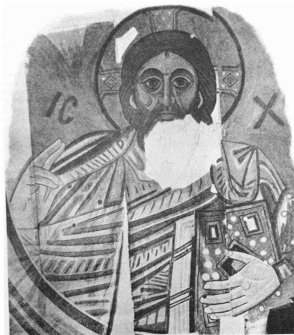
Рис. 10. Христос Панккратор. Мозаика в куполе собора св. Софии Киевской. XI в.