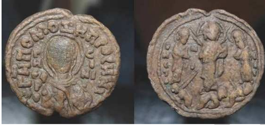
Рис. 2. Печать, найденная при раскопках в Новгороде в 1968 г.

ний: МЕТА(МОР)Ф(О)С(І)С ). На лицевой стороне печати помещено поясное изображение святой и вырезано ее имя в виде колончатой надписи по обеим сторонам от изображения. Имя написано по-русски ровными четкими буквами и читается как ИЕФРОСІНЯ . Кроме того, изображение святой обрамлено круговой надписью: Г[оспод]и, помози рабе своеи Ефросини нарецаемой (рис. 2).