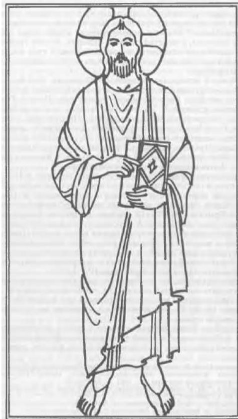
Рис. 9. Христос Пантократор. Мозаика в куполе церкви Св. Марии «Адмиральской». XII в.

В целом изображение Христа, читающееся на оборотной стороне печати 2015 г., имеет многочисленные параллели в византийской сфрагистике. В частности, поясные и погрудные изображения Вседержителя с крещатым нимбом, благословляющим жестом правой руки (прижатой к груди или слегка отведенной от нее) и закрытым Евангелием в левой руке часто встречаются на императорских печатях XI в. 41