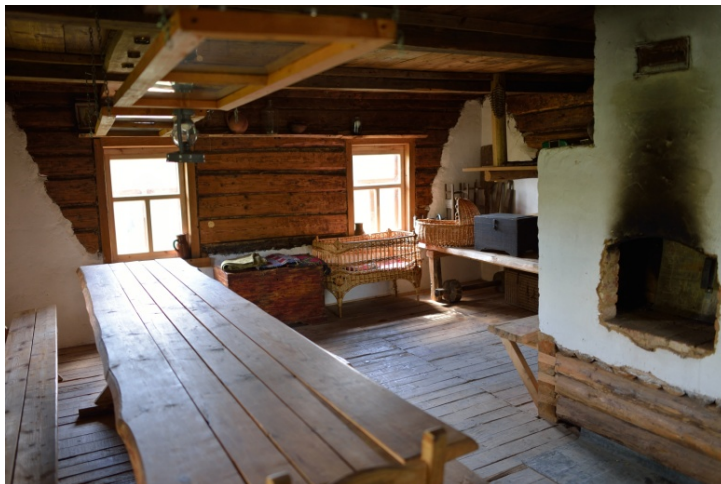
Рисунок 3 – Интерьер жилого дома

В заключении хочется отметить, что белорусское народное деревянное строительство достаточно разнообразно и многогранно, но также тесно переплетается и имеет сходные черты с народным строительством других регионов и государств [2]. При этом собранные на территории Могилёвского этнографического комплекса традиционных народных промыслов постройки очень характерны и типичны для него, но, естественно, они не могут отобразить всю полноту и многообразие архитектурных и конструктивных решений. Следовательно, для формирования полной картины требуется составлять комплексный туристический маршрут, который затрагивал бы все регионы Республики Беларусь и позволял бы осуществлять поэтапную передачу туристических групп от одного объекта к последующим, начиная от западных границ государства и заканчивая восточными и наоборот.