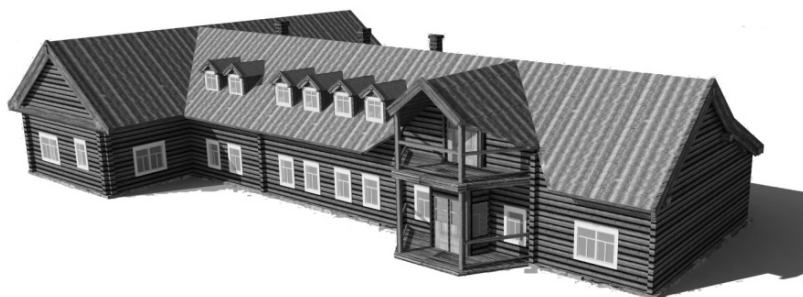
Рисунок 3 – Реконструкция основного здания агроусадьбы «Кролова хата»

Для основного здания предполагается осуществление реконструкции: расширение корпуса, использование пространства чердака для размещения жилых комнат (рис. 3). Предусмотрено размещение в здании бывшей школы центра творчества для выездных пленэров (рис. 4) с созданием мастерских художников, музея деревни Заборье, классов народно-прикладного творчества, жилых комнат и др.