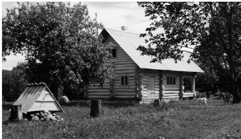
Рисунок 1 – Гостевой домик агроусадьбы «Ёдишки» в Поставском районе

Такое направление развития агротуризма – внедрение «кластерной» системы – ответ на конкуренцию и встраивание объектов агротуризма в систему народнохозяйственного комплекса. В связи с этим каждая агроусадьба должна, во-первых, предельно ответственно определить свое лидирующее направление, например, охота или краеведение, или гончарное производство и т.д. (рис. 1) и, во-вторых, продумать возможности реализации дополнительных видов услуг. За всем этим стоит создание или совершенствование необходимой инфраструктуры: здания и сооружения, площадки, стоянки, маршруты и т.д.