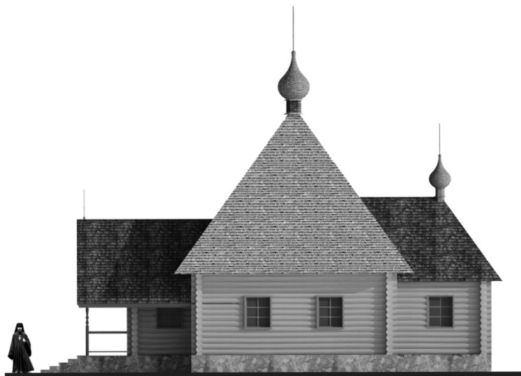
Рисунок 5 – Боковой фасад часовни в Заборье

При восстановлении этой гидроэлектростанции были сохранены стилистические особенности архитектуры 1950-х гг. Борьба с излишествами во второй половине того десятилетия уже велась вовсю. Но сооружение достраивалось, как и было запроектировано. Поэтому получило высокие щипцы торцовых стен, карнизы в виде поясков, полукруглое окно с обрамлением и замковым камнем. Эти сохранившиеся рудименты архитектуры послевоенного десятилетия, в течение которого архитектура искала пути увековечивания знаменательной победы в Великой Отечественной войне, сегодня воспринимаются как некая закономерность, привлекают внимание и становятся достопримечательностями.