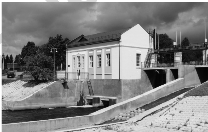
Рисунок 6 – Гидроэлектростанция в Клястицах Россонского района. Капитальный ремонт, 2008 г.

Местные жители очень уважительно, даже с оттенком гордости, отзываются о своей микрогидроэлектростанции. По берегам водоема всегда можно встретить рыбаков. Здесь оборудованы места для отдыха, стоянки для автомобилей. А это значит, что сюда заглядывают как путешественники, которые прознали об этой достопримечательности, так и местная молодежь. Не случайно малые гидроэлектростанции не только производят столь необходимую нам электроэнергию, но стали важными объектами туристической деятельности, да и просто эффектными, ухоженными уголками белорусской действительности (рис. 6).