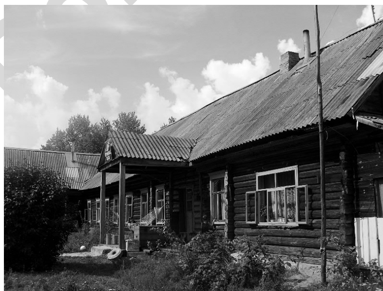
Рисунок 2 – Усадьба «Кролова хата» в Заборье Россонского района

В Заборье Россонского района основа объекта агротуризма – большой бревенчатый дом площадью 180 м 2 , который ранее был сельской больницей [4, с. 95]. Здесь стала формироваться (рис. 2) одна из первых агроусадьб Беларуси – «Кролова хата», входящая в туристическое золотое кольцо Россонского района. Крытое крыльцо перед входом, переплеты окон, пять печей, бревенчатые стены в интерьере напоминают о прошлом. Такой тип агроусадьб – реконструированное здание не жилого назначения, довольно редко встречается по областям республики, но, безусловно, демонстрирует хозяйственный, рачительный подход к материальным ценностям (к фонду зданий) и, что важно, сохраняется сложившаяся среда поселения.