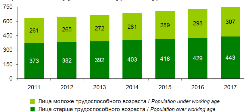
Рисунок 1. – Коэффициенты нагрузки на трудоспособное население