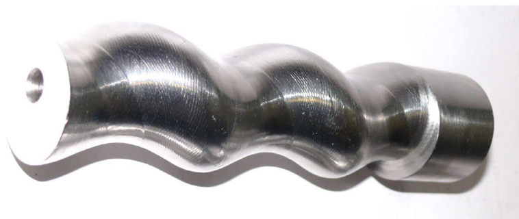
Рис. 2. Образец ротора, обработанного на токарно-затыловочном станке

Такую кинематику формообразования обеспечивает станок [2] для обработки винтовых поверхностей. Анализ известных станков различного функционального назначения показал возможность реализации схемы формообразования круговых и каналовых винтовых поверхностей на универсальных токарно-затыловочных станках, что позволило при минимальных затратах решить задачу производства роторов винтовых насосов взамен поставляемых по импорту. На рис. 2 показан образец ротора одновинтового насоса, обработанного на токарно-затыловочном станке модели 1Б811 по рассмотренной выше схеме формообразования. Реализация результатов исследований и проектно-конструкторских работ позволила освоить производство роторов одновинтовых насосов и технологической оснастки для изготовления статоров к ним.