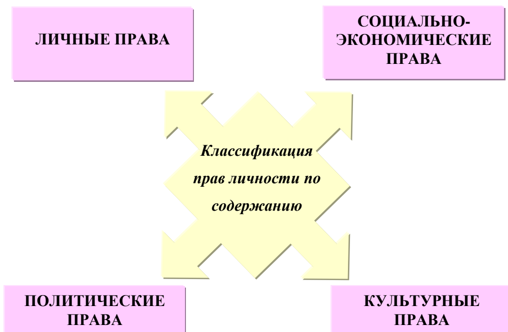
Рисунок 1 – Классификация прав личности по содержанию