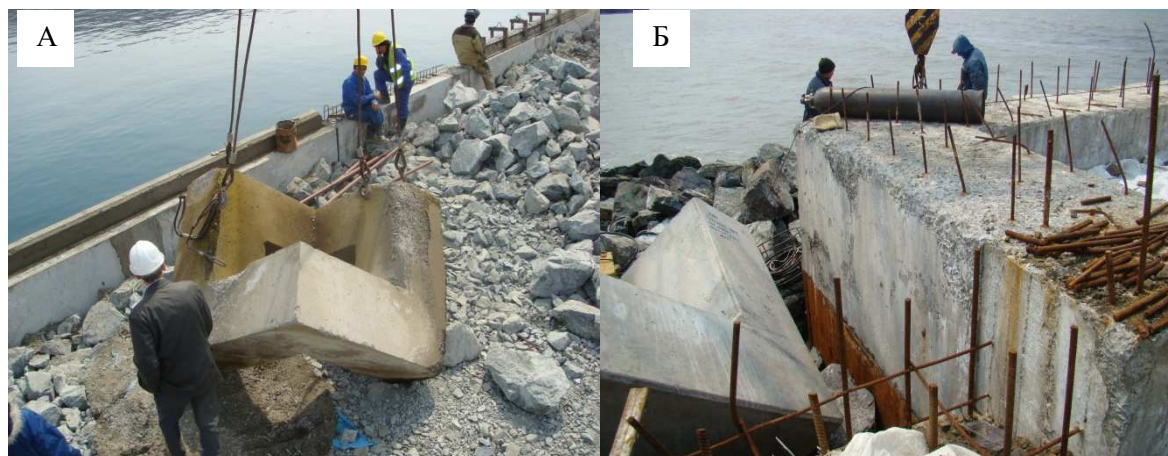
Рисунок 2. – Характерный вид разрушения бетона в зоне переменного уровня после первого зимнего сезона: А – берегоукрепление из гексабитов в порту Козьмино (г. Находка, Приморский край, 2008); Б – причальная стенка в порту Углегорск (о. Сахалин, 2010).

платационных свойств отказ можно классифицировать как по критичности, так и по причинам его возникновения. В рассмотренных случаях отказ относится производственному отказу, поскольку произошел вследствие производственных недоработок. Явный внезапный отказ обусловлен, с одной стороны, характером внешних воздействий- обмерзанием конструкций морским льдом, с другой- не обеспечены условия выдерживания бетона при положительных температурах после пропаривания. Есть все основания считать, что процесс накопления структурных дефектов в бетоне при обмерзании морским льдом происходит более интенсивно, чем при воздействии циклов замораживания и оттаивания от обычных отливно-приливных явлений в зоне переменного уровня вертикальных стенок морских причальных сооружений.