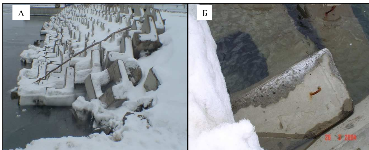
Рисунок 1. – А – общий вид берегозащитного сооружения корневой части причала МОФ (п. Пригородное, завод СПГ, о. Сахалин) в зимний период; Б – характер разрушения бетонных блоков (гексабитов) после первого зимнего сезона

В данной статье приводится анализ характерных случаев разрушения бетона при строительстве морских гидротехнических сооружений на Дальнем Востоке за период с 2003 по 2010 гг. Например, при строительстве берегозащитного участка корневой части причала МОФ на заводе сжиженного природного газа (СПГ) в п. Пригородное (о. Сахалин) из фасонных блоков- гексабитов (далее- блоков), наблюдали разрушение бетона в отдельных блоках, расположенных в зоне переменного уровня, после первого зимнего сезона. (рисунок 1).