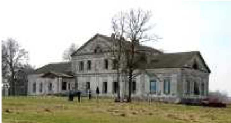
Веска Галошава. Сядзіба XIX стагоддзя

Значную і таксама амаль цалкам страчаную частку архітэктурнай спадчыны рэгіёна прадстаўляюць былыя шляхецкія сядзібы з маляўнічымі паркамі, гаспадарчымі і вытворчымі пабудовамі [6]. Каля вёскі Галошава ацалелі рэшткі сядзібы Цюндзявіцкіх канца XIX – пачатку XX стагоддзя, што ўключала сядзібны дом, гаспадарчыя пабудовы і пейзажны парк. Мураваны панскі дом узведзены ў 1897 годзе ў традыцыях мясцовай сядзібнай архітэктуры з элементамі неакласіцызму.