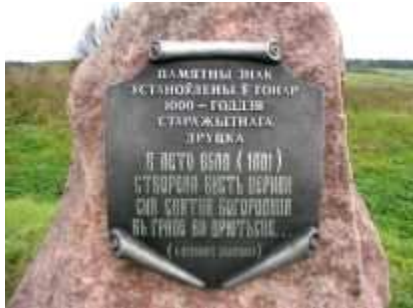
Памятны знак 1000-годдзю паселішча, Друцк

Царква неаднаразова гарэла і перабудоўвалася. У XVII стагоддзі пры ёй існаваў праваслаўны манастыр, у пачатку XVIII стагоддзя, да 1726 года, яна перайшла да уніятаў, а ў 1838 годзе была вернута праваслаўным. Яшчэ праз 100 гадоў, у 1938 годзе, з царквы знялі крыжы, а ў 1942 годзе яна была апошні раз спалена. На яе месцы ў 2001 годзе быў устаноўлены мемарыяльны знак з нагоды святкавання 1000-годдзя Друцка, побач зроблена рэканструкцыя фрагментаў умацаванняў старажытнага гарадзішча: драўляных чацверыковых вежаў і востракола.