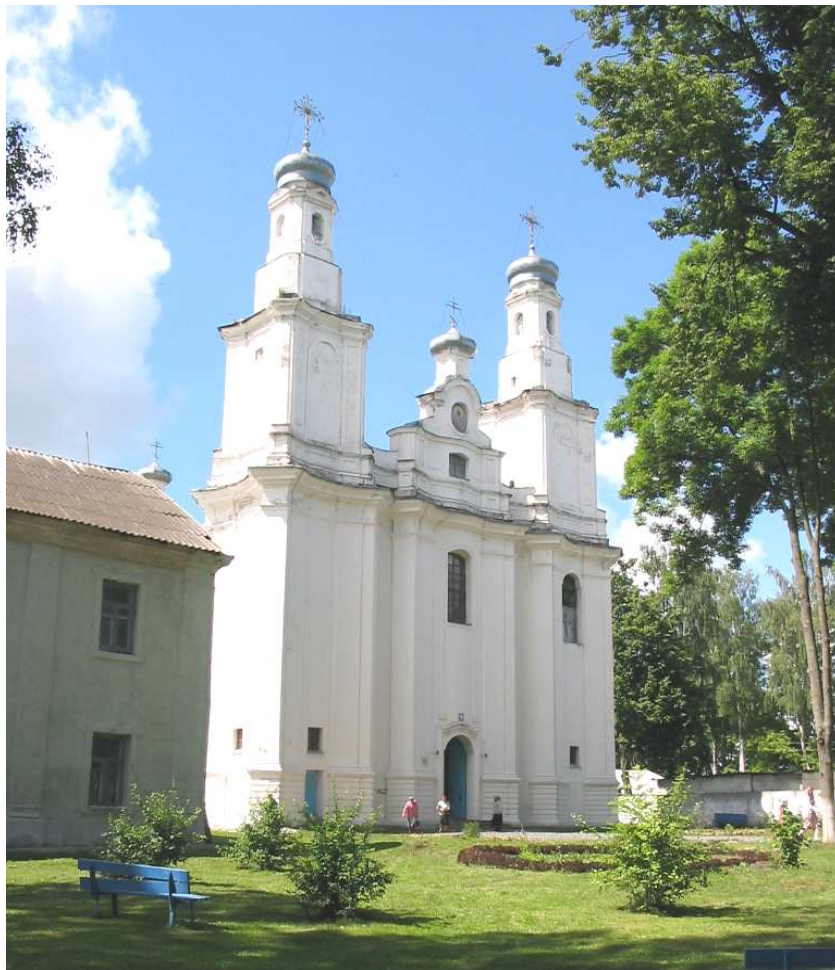
Пакроўская царква XVIII стагоддзя, Талачын

стала прываслаўнай. У гэты ж час у вопісу мястэчка адначаецца таксама наяўнасць «праздной Рымскай царквы», што знаходзілася ў Зарэчным Талачыне. Магчыма, што гэтае недакладнае вызначэнне тычыцца як раз адзінага ў мястэчку каталіцкага храма, прынамсі касцёла, заснаванага некалі Сапегам, які на той час ужо быў закрыты. У дакуменце адзначана таксама мураваная Пакроўская царква пры манастыры базыльян, якая на сённяшні дзень з'яўляецца найбольш каштоўным архітэктурным помнікам усяго Друцка-Талачынскага рэгіёна. Цяпер комплекс былога манастыра базыльян належыць прываслаўнаму жаночаму Свята-Пакроўскаму манастыру Віцебскай епархіі Беларускага Экзархата Маскоўскай Патрыярхіі.