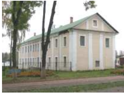
Манастырскі корпус XVIII стагоддзя, Талачын

Архітэктура Пакроўскай царквы з'яўляецца яркім узорам позняга беларускага барока, звананага віленскім. Мастацкім узорам для яе стаў, верагодна, архітэктурны вобраз касцёла дамініканцаў у мястэчку Смаляны (менш за 40 км ад Талачына), якое таксама належала князям Сангушкам. Кляштар дамініканцаў заснаваны тут Геранімам Сангушкам яшчэ ў 1678 годзе, а новы касцёл змураваны ў 1760-я гады манахам-дамініканцам Людвікам Грынцэвічам, вядомым мясцовым дойлідам, які атрымаў прафесійную адукацыю ў Рыме. Структура фасада і вежаў Пакроўскай царквы цалкам ідэнтычна касцёлу ў Смалянах [4, с. 83–84]. Кампазіцыйныя і канфесійныя адрозненні паміж імі выяўлены ў форме алтарнай часткі, у адсутнасці ў талачынскім храме трансепта (папярочнага нефа) і наяўнасці мураванай алтарнай перагародкі, характэрнай для уніяцкіх храмаў. Высокі прафесійны і мастацкі ўзровень архітэктуры талачынскай уніяцкай царквы дазваляе меркаваць пра магчымы ўдзел у яе будаўніцтве такіх таленавітых архітэктараў таго часу, як Людвік Грынцэвіч ці Аляксандр Асікевіч (вядомы архітэктар-базыльянін).