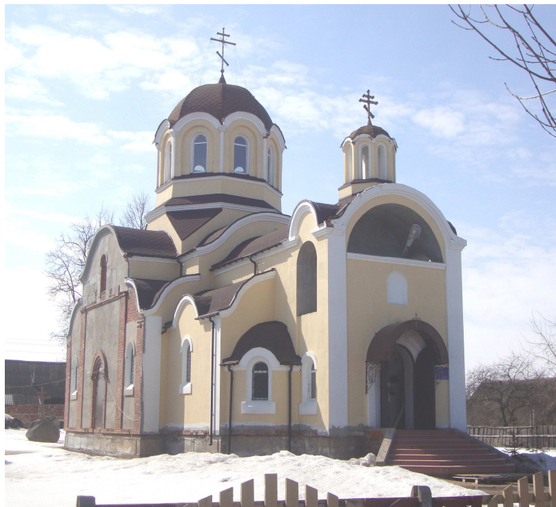
Увядзенская царква. XXI стагоддзе, Талачын

Будынак мае сіметрычную аб'ёмна-прастоавую кампазіцыю з двухпавярховай цэнтральнай часткай і аднапавярховымі бакавымі крыламі, перакрытымі ўзаемна перпендыкулярнымі двухсхільнымі дахамі з трохвугольнымі франтонамі на тарцах. У дэкоры выкарыстаны пілястры, філёнчатыя нішы, руставыя абрамленні лучковых вокнаў. Эклетычнасць збудавання выяўляе несіметрычнае размяшчэнне невялікага ўваходнага чатырохкалоннага порціка. Захаваліся фрагменты паркавых алей, сажалка, рэшткі двухпавярховага цаглянага флігеля. У 1996 годзе на беразе возера ў межах сядзібы пастаўлены вялікі крыж з каменнага маналіту.