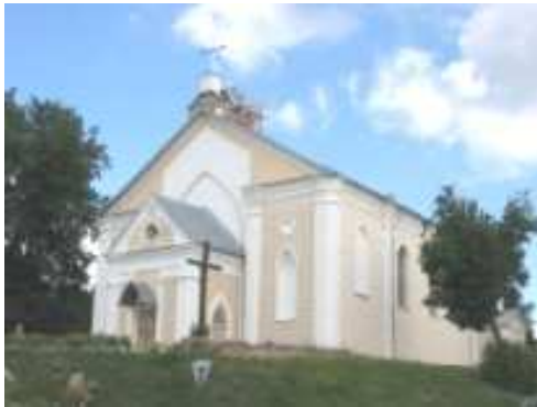
Касцёл XIX стагоддзя, Талачын

і асвечаны ў 1796 годзе ў гонар Пакрова Багародзіцы як уніяцкая царква. Таму нельга атаясамліваць гэты помнік з касцёлам, што сустракаецца ў шэрагу публікацый.