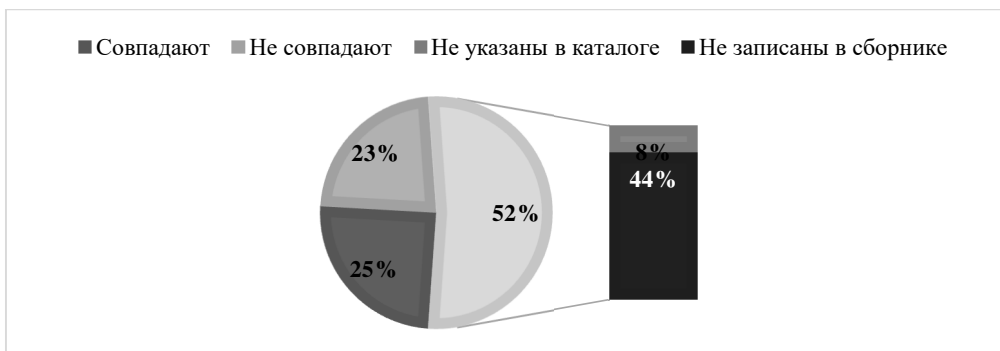
Рисунок 2. – Соотношение данных о количестве погребённых в воинских захоронениях каталога воинских захоронений (2013 г.) и свода памятников (1985 г.)

На качественно новом уровне политика мемориализации осуществляется в Беларуси. Сегодня руководством деятельности по увековечению памяти и координацией работы занимается управление по увековечению памяти защитников Отечества и жертв войны Вооружённых Сил на основании Указа Президента Республики Беларусь от 30 ноября 1994 № 231. Управление проводит архивно-исследовательскую работу, организует полевые поисковые работы и учёт захоронений. Ежегодно, начиная с 2012 года, Министерство обороны совместно с облисполкомами систематизирует информацию по одной из областей и издает каталог воинских захоронений [6]. В 2013 г. в свет вышел каталог воинских захоронений по Витебской области [7], сравнение данных которого с информацией свода даёт возможность нам выделить ряд положительных и отрицательных тенденций в политике увековечения памяти.