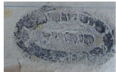
Малюнак 7. – Пячатка віцебскага духоўнага рабіна М.З. Гурэвіча, 1927 г. [7, арк. 11]