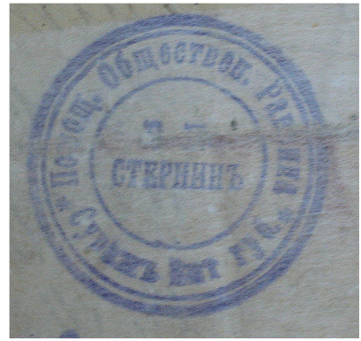
Малюнак 4. – Пячатка памочніка віцебскага грамадскага рабіна ў Суражы І.Б. Стэрніна, 1913 г. [5, арк. 4 адв.]

Такім чынам, на прыкладзе Віцебскай губерні бачна, што ў пачатку ХХ ст. суіснавалі два інстытуты рабінства: казённыя (грамадскія) і духоўныя. І хоць функцыі ў іх, па сутнасці, былі аднолькавымі, самі яны мелі значныя адрозненні, што вынікала з іх статусу, бо казённыя рабіны прызначаліся са згоды мясцовых улад, а духоўныя абіраліся абшчынай. Калі на працягу даследуемага перыяду колькасць казённых рабінаў была