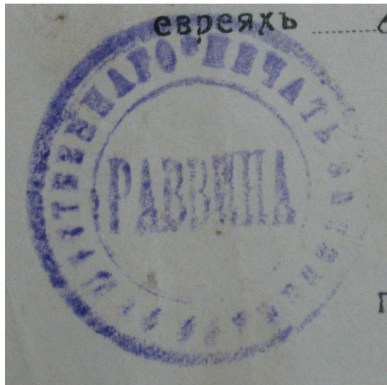
Малюнак 2. – Пячатка віцебскага грамадскага рабіна, 1919 г. [5, арк. 24]

Паколькі рабіны з’яўляліся службовымі асобамі, яны мелі ўласныя пячаткі, якімі завяралі дакументы для надання ім юрыдычнай моцы: лісты, хадайніцтвы, выпіскі з метрычных кніг і да т.п. Пячаткі віцебскіх казённых і грамадскіх рабінаў былі простымі ў афармленні: у круглым полі змяшчалася рускамоўная легенда, якая сведчыла пра пасаду яе ўладальніка, а таксама магла прысутнічаць выява герба Расійскай імперыі (гл. мал. 2, 3). У адрозненне ад іх пячаткі памочнікаў віцебскага грамадскага рабіна мелі надпісы пра імя асобы, якая займала дадзеную пасаду і месца службы (гл. мал. 4). Пячаткі духоўных рабінаў былі больш складанымі паводле свайго афармлення. Яны маглі быць не толькі круглымі па форме, але таксама авальнымі, прамавугольнымі ці ўвогуле не мець акрэсленых межаў. Яны абавязкова былі персанальнымі: утрымлівалі звесткі пра імя рабіна і месца размяшчэння абшчыны, якую ён ўзначальваў. Легенда, як правіла, была двухмоўнай: у верхняй частцы адбітка – на іўрыце, а ў ніжняй – па-руску, але часам вырабляліся толькі іўрытамоўныя пячаткі (гл. мал. 5 – 7). Неабходна адзначыць, што гэтымі ж пячаткамі рабіны працягвалі карыстацца і пасля Кастрычніцкай рэвалюцыі 1917 г.