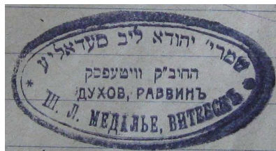
Малюнак 6. – Пячатка віцебскага духоўнага рабіна Ш.-Л.Я. Медалье, 1927 г. [7, арк. 11]