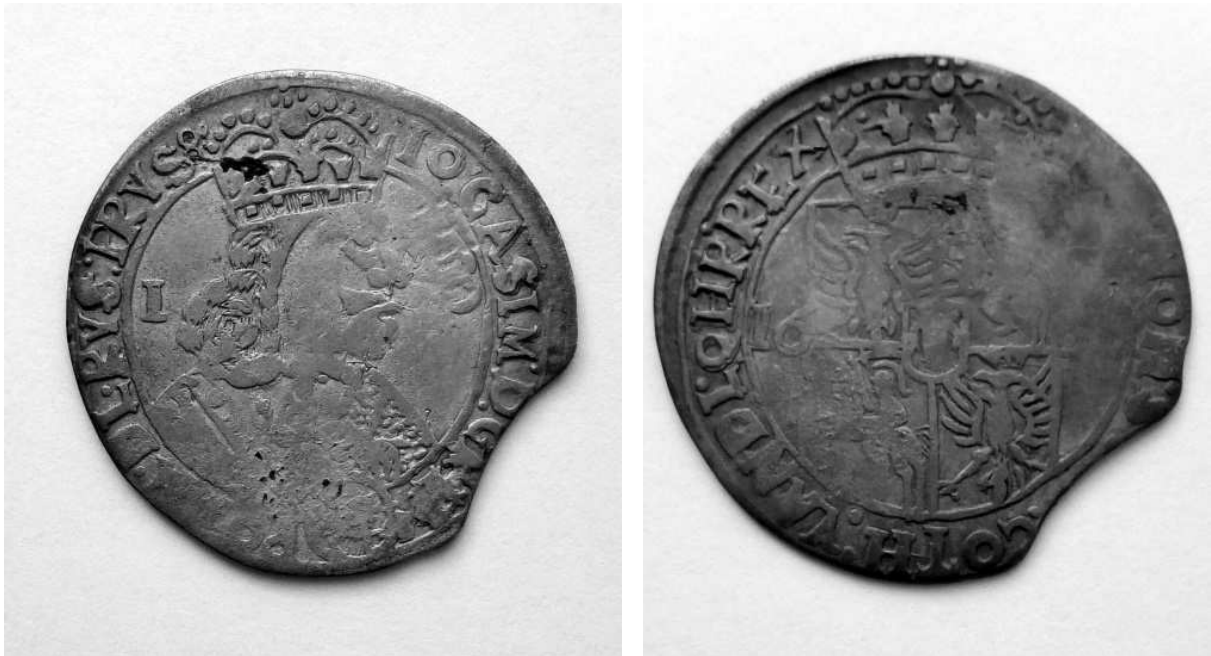
Фототаграфия 1. – Аверс и реверс монеты

в связи с военными действиями, Речь Посполитая оказалась в тяжелом финансовом положении. Ян Казимир нуждался в деньгах и помощь ему оказала католическая церковь. С разрешения Папы римского, польскому королю был дан займ в виде драгоценных культовых предметов, которые было решено переплавить и отчеканить монеты. Но шведские войска, вторгнувшись в страну в 1655 г., захватили почти все крупные города, в том числе и те, где находились монетные дворы: Вильно, Краков, Познань. Единственным крупным городом, в котором можно было организовать монетный двор являлся Львов. В середине мая 1656 г. во Львове были отчеканены первые монеты. Двор находился в городе до 24 января 1657 г., когда был переведен в Ополь. Львовские монеты 1656-1657 гг. любопытны не только историей своего создания, но и спецификой исполнения, связанной с недостаточным профессионализмом работников монетного двора: они интересны своей неповторимостью и разнообразием оформления (фото 1).