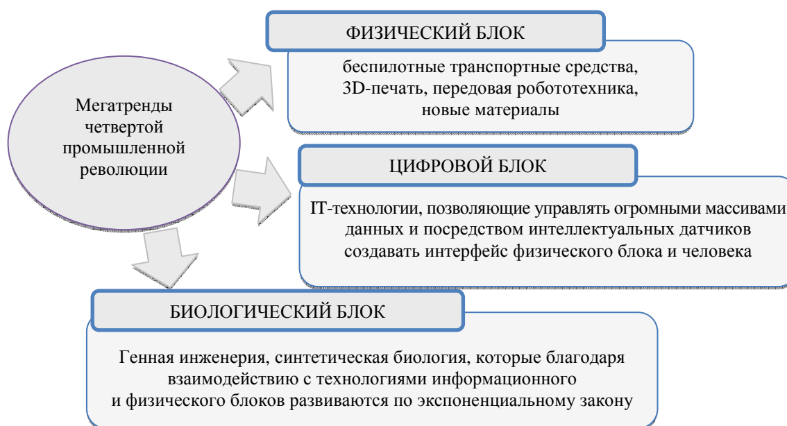
Рисунок 1. – Сущность мегатрендов четвертой промышленной революции

На основании результатов исследований, проведенных Всемирным экономическим форумом, а также на основании результатов, полученных в ходе работы глобальных экспертных советов, Президент Всемирного экономического форума К.М. Шваб в своей работе [6] определяет три блока мегатрендов, основанных на ключевых технологиях четвертой промышленной революции, сущность которых проиллюстрирована на рисунке 1.