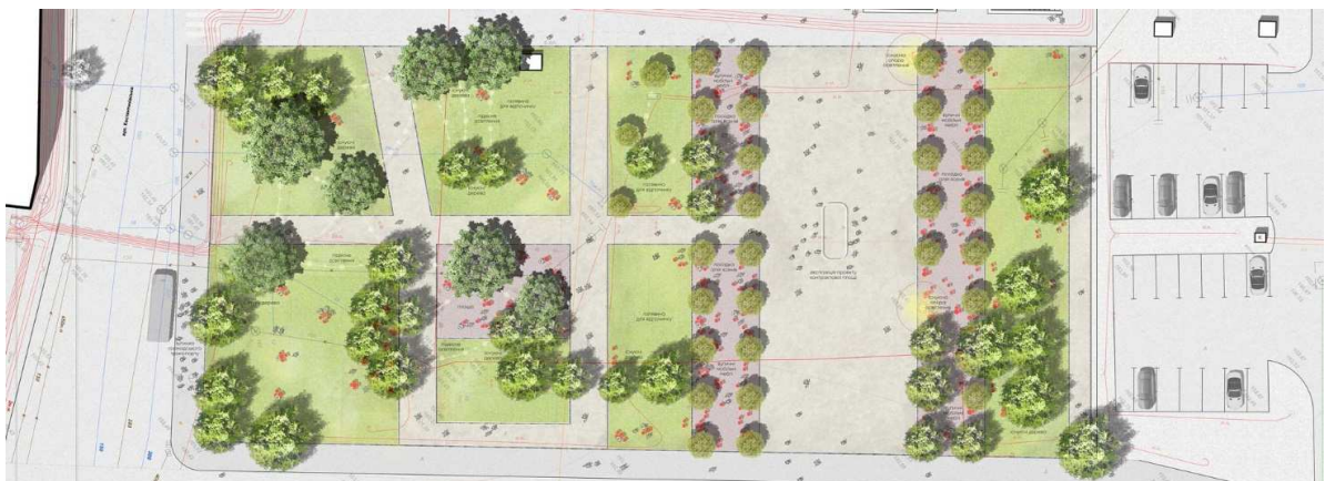
Рисунок 11. – Проект реконструкции сквера № III на Контрактной площади «Студия ландшафтной архитектуры Максима Коцюбы»