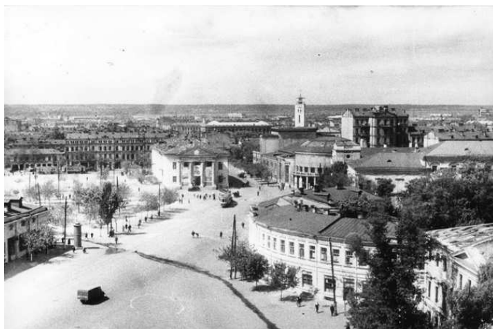
Рисунок 3. – Контрактная (Красная) площадь 1946 год