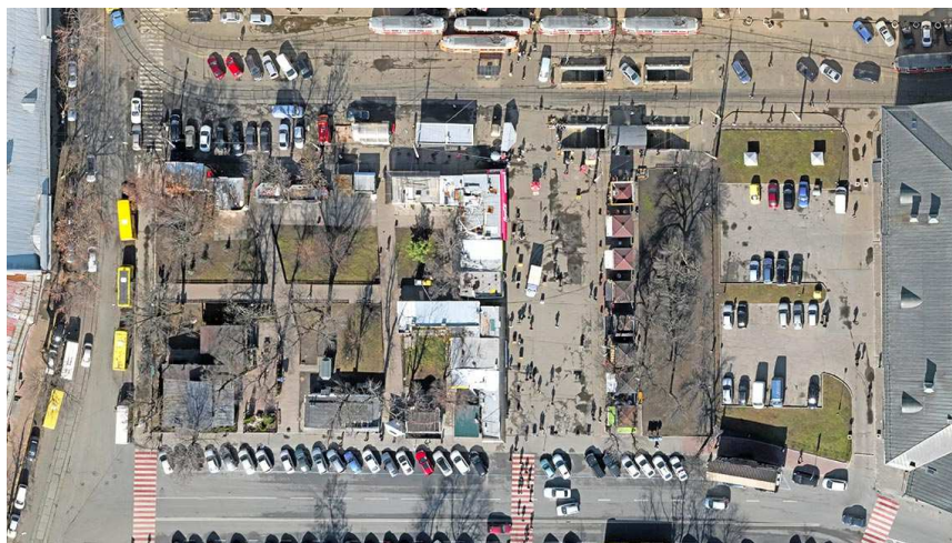
Рисунок 8. – Контрактная площадь. Сквер №3. 2016 г.

В 1976 г. Украинским научно-исследовательским и производственным управлением по заказу властей был разработан проект реконструкции площади на исторической основе. Главным архитектором была Валентина Шевченко. На протяжении многих лет по этому проекту были воссозданы Гостиный двор, фонтан «Самсон» с ротондой, церковь Успения Богородицы Пирогощи, колокольня Греческого монастыря, отреставрирован академический корпус Киево-Могилянской академии, Контрактный дом. В 1991 г. после обретения Украиной независимости проект перестали финансировать, невыполненными остались работы по восстановлению Магистрата, завершению ансамбля общественного центра Уильяма Гесте и благоустройству площади.