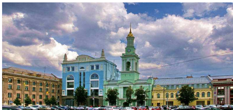
Рисунок 7. – Стоянка транспорта на Контрактной площади 2016 год

В начале 90-х годов сквер возле метро обрастает киосками и небольшими магазинчиками, что уродует внешний вид площади и только в 2017 году эти МАФы, наконец, сносятся. Кроме того, на площади находятся многочисленные хаотичные парковки автомобилей. Огромной проблемой становится транспортное сообщение на площади – её пропускная способность не рассчитана на возросший транспортный поток.