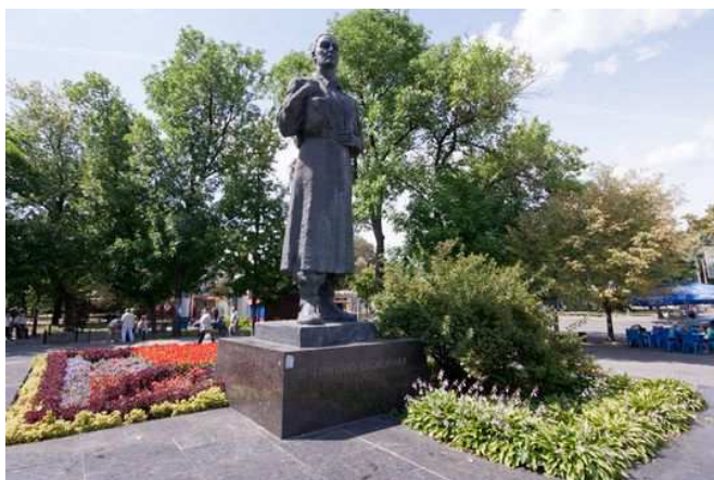
Рисунок 5. – Памятник Г.С. Сковороде на Контрактной площади

С развитием транспорта площадь становится важной транспортной развязкой, соединяющей метро, трамвай, троллейбусы и автобусы. В 1976 году сооружается памятник украинскому писателю и философу Григорию Сковороде.