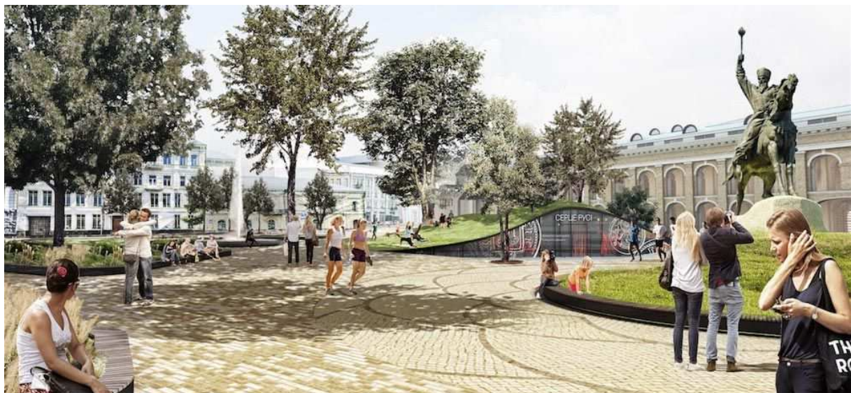
Рисунок 12. – Реконструкция Контрактовой площади. Авторский коллектив «Киевская гостиная»

Одной из наиболее сложных задач во время реконструкции насаждений парка, является создание напочвенного покрова под деревьями. Устойчивая тень под липами и кленами не позволяет использовать газонное покрытие – злаковые травы в условиях затенения гибнут. Для решения этой проблемы мы