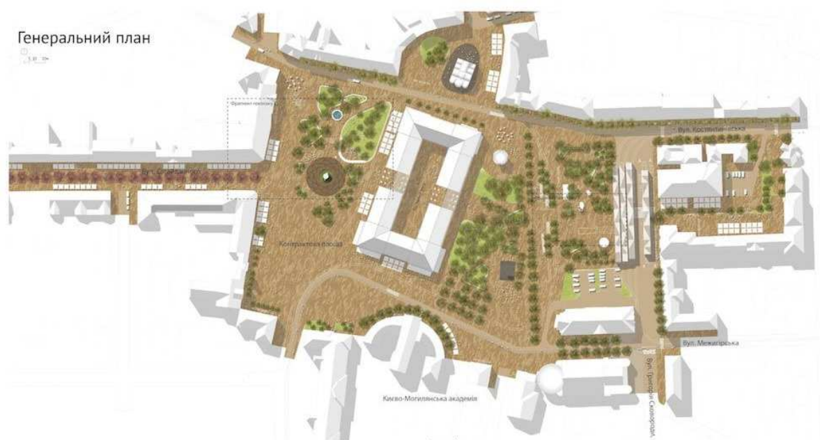
Рисунок 9. – Проект реконструкции Контрактовой площади. Авторский коллектив «Киевская гостиная».