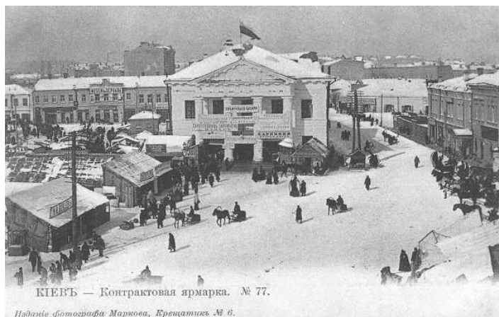
Рисунок 2. – Контрактная (Александровская) площадь 1913 год

Сейчас на площади растут 1618 экземпляров деревьев и кустарников, из них 496 деревьев. Среди них выделено 65 видов и 24 культивара, которые принадлежат к 41 роду и 23 семействам. Наиболее распространены одиннадцать видов деревьев, которые составляют почти 77% от общего количества. Большинство деревьев отнесены к I и II категории санитарного состояния, т.е. практически здоровы. К III категории отнесены ряд деревьев, заселенных Viscum album L., это виды Fraxinus lanceolata Borkh, Acer sacharinum March., Robinia pseudoacacia L., Populus balsamifera L [9].