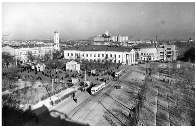
Рисунок 4. – Контрактная (Красная) площадь 1953 год

С развитием транспорта площадь становится важной транспортной развязкой, соединяющей метро, трамвай, троллейбусы и автобусы. В 1976 году сооружается памятник украинскому писателю и философу Григорию Сковороде.