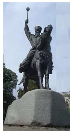
Рисунок 6. – Памятник гетьману П.К. Сагайдачному в Киеве

После провозглашения независимости Украины на площади отстраивается уничтоженная в 30 –х годах прошлого столетия церковь Успения Богородицы Пирогощи. В сквере перед Гостиным двором устанавливается величественный памятник гетману Петру Канашевичу-Сагайдачному (2001 г.).