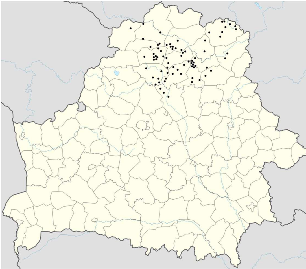
Малюнак 3. — Могільнікі Беларускага Падзвіння XIV–XVIII стст. з каменнымі надмагіллямі Заўвага: паводле [36, с. 19].

Каменны надмагілляны канструкцыі Беларускага Падзвіння пачалі рэгістраваць і апісваць у XIX ст. (мал. 3). Першая вядомая згадка маркіраваных каменнымі крыжамі познесярэднявечных пахаванняў у асабістым ліставанні даследчыкаў-аматараў адносіцца да 1818 г. Старадаўнімі камянямі зацікавіўся інтэндант I арміі генерал-лейтэнант Я.Ф. Канкрын. Ён даў адпаведнае даручэнне падначаленым. У адказе на запыт наглядчык правянецкай крамы ў Полацку Рэпін паведаміў аб каменных крыжах у маёнтку Бяздзедавічы і ў в. Экімань каля Полацка [1, с. 26, 30–39]. Ужо згаданы крыж у Бяздзедавічах меў выбітую дату: 1650 г. [14, с. 103–104].