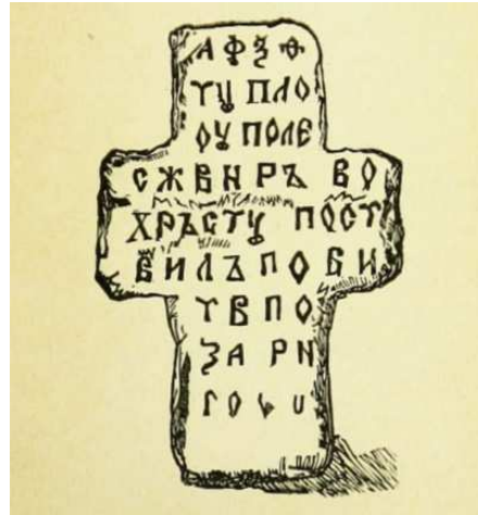
Малюнак 4. — Каменны крыж каля маѐнтка Сокарава