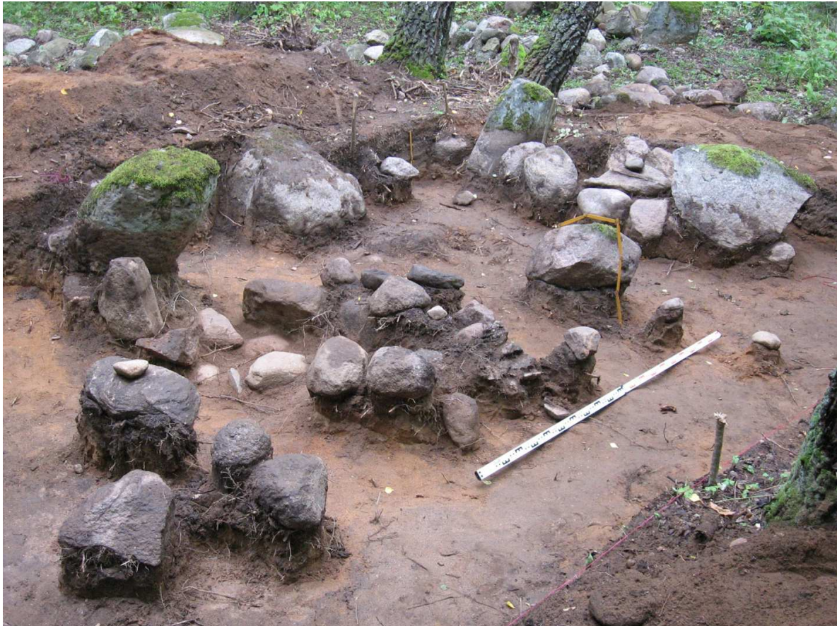
Малюнак 5. — Могільнік каля в. Івесь Глыбоцкага р-на Віцебскай вобл. Раскопкі 2015 г. Каменныя канструкцыі, ускрытыя на глыбіню да 0,4 м. Выгляд з паўднёвага ўсходу

Раскопки на могильнике Стары Лепель Лепельскага раёна праводзіла З.А. Харытановіч (Ільчышын). Адкрытыя ёй пахаванні не былі абзначаны надмагіллямі, але на могілках меліся каменныя крыжы [35, с. 300; 43, с. 2].