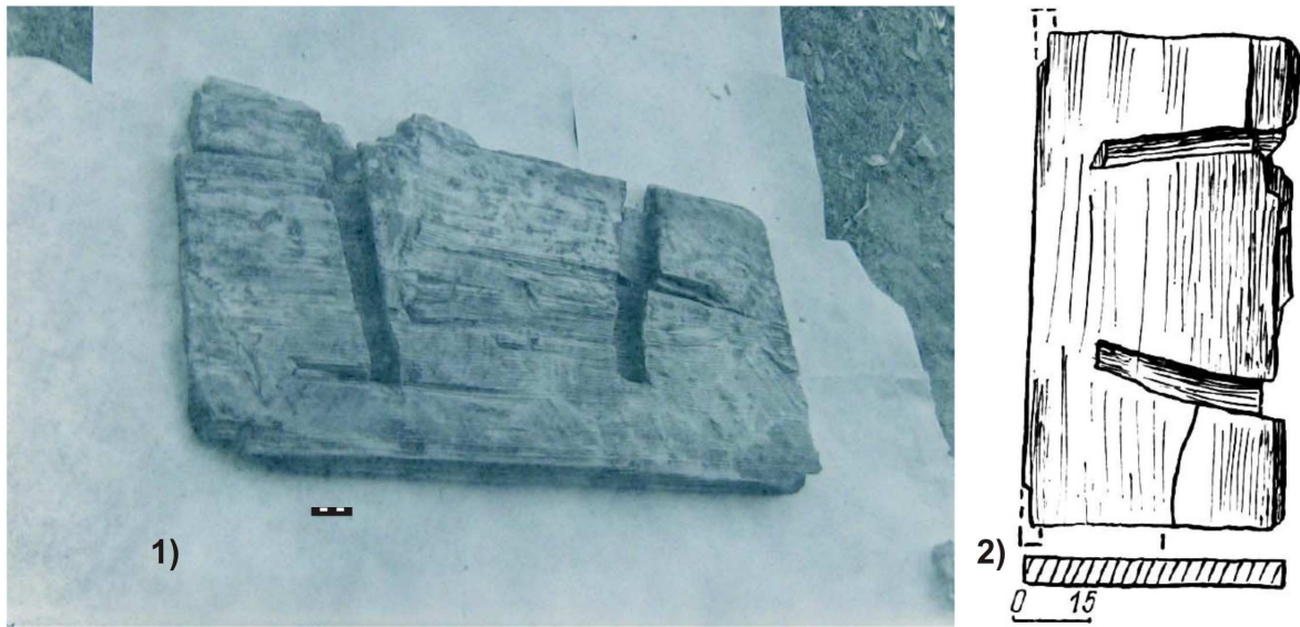
Малюнак 1. – Археалагічная знаходка дошкі дзвярэй (першая): 1) фотаздымак; 2) прамалёўка

равышаць 80 см. Такія, амаль квадратныя і невысокія дзверы, маглі размяшчацца толькі ў гаспадарчых пабудовах.