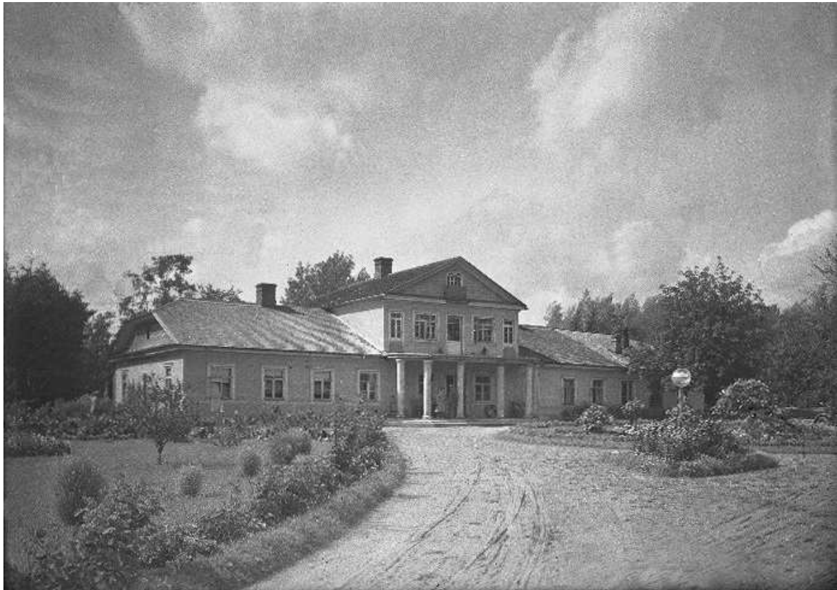
Рисунок 3. – Помещичий дом («рум»). Имение Каменополье, Браславский повет. Фото 30-х гг. XX в.

Начиная со второй половины XVII в. развитие деревянного помещичьего жилища было связано только с постройками на низком фундаменте. Доминирующей формой было прямоугольное в плане длинное жилое сооружение с комплексом подсобных и служебных помещений (рис. 3, 4). В документах XVIII в. на польском языке оно обозначалось по-разному. Часто употреблялись наименования «dom», «dom mieszkalny», «dom rezydencyonalny», «rum», «rum mieszkalny», «rum rezydencyiny», «rum gospodarski», «budynak», «budynak mieszkalny», «budynak rezydencyalny», реже – «palac», «pokoi», «izba mieszkalna». Одним из наиболее распространенных названий жилого дома была номинация «rum». Она являлась лингвокультурным синонимом старобелорусского наименования «дом великий долгий при земли».