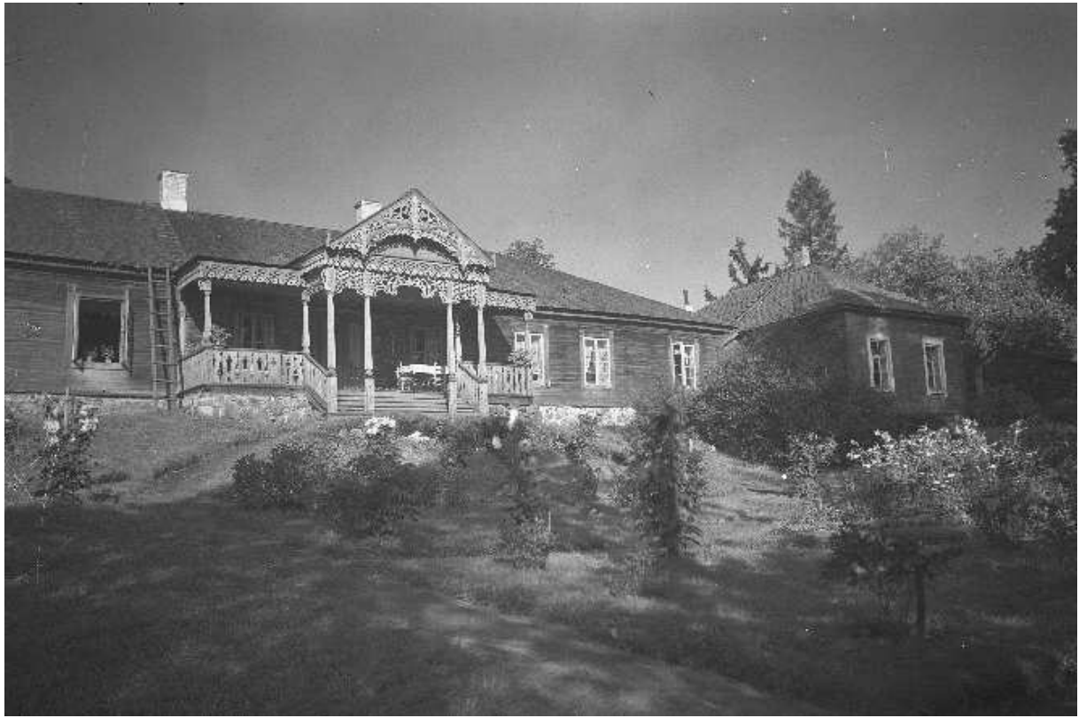
Рисунок 4. – Жилые постройки в помещичьем дворе. Имение Крицевичи, Брагавский повет. Фото 30-х гг. XX в.

«для челяди». Семантический анализ их содержания в контексте многочисленных описаний надворных построек разного функционального назначения показал, что все базовые номинации жилища, за исключением с основами «дом» и «gum», использовались также для обозначения хозяйственных объектов.