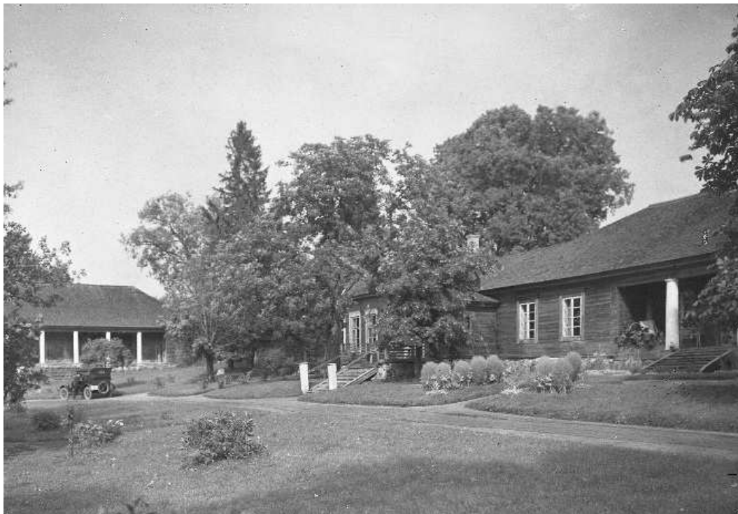
Рисунок 2. – Двор имени Крицевичи, Брагславы повет. Фото 30-х гг. XX в. Instytut sztuki PAN