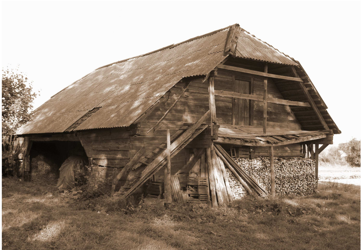
Рисунок 5. – Амбар. Двор Лабецких «Пласковичи». Вторая пол. XIX в. Тесновка, Клецкий р-н Минской обл. 2009 г.

Отдельной группой в структуре надворных построек были представлены строения, предназначенные для содержания лошадей, хранения и стоянки транспортных средств. Конюшня обозначалась, как правило, культурным термином «стайня» («stajnia»). В зависимости от количества стойл название «стайня» могло употребляться в сочетании с определениями «великая» и «малая». Большие конюшни строили с расчетом на размещение в них лошадей гостей, а в крупных государственных имениях на случай приезда великого князя и вельмож со свитой. В богатых помещичьих дворах иногда встречались конюшни специального назначения. К их числу относились постройки для отдельного размещения лошадей владельца имения («stajnia skarbowa»), гостей («staienka dla goscinnych koni», «stajnia na konie goscinne», «stajnia gościnna»), рабочих животных («staienka na koni służny», «stajnia na fołwarczne konie») [4, с. 118]. Постройка для транспортных средств располагалась в блоке с конюшней либо неподалеку от нее. В исторических источниках она обозначается терминами «стайня», «стайня на возы», «обозня», «wozownia». В XVII – XVIII вв. название «wozownia» получило повсеместное распространение в помещичьих дворах.