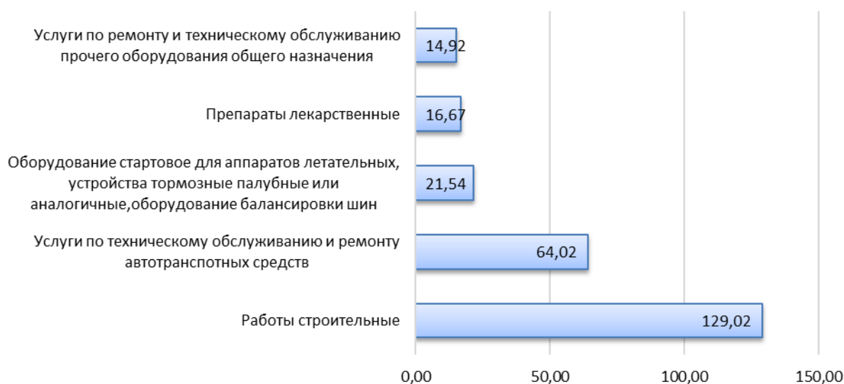
Рисунок 2. – Информация о номенклатуре закупаемых у СМСП товаров, работ, услуг, млрд руб.