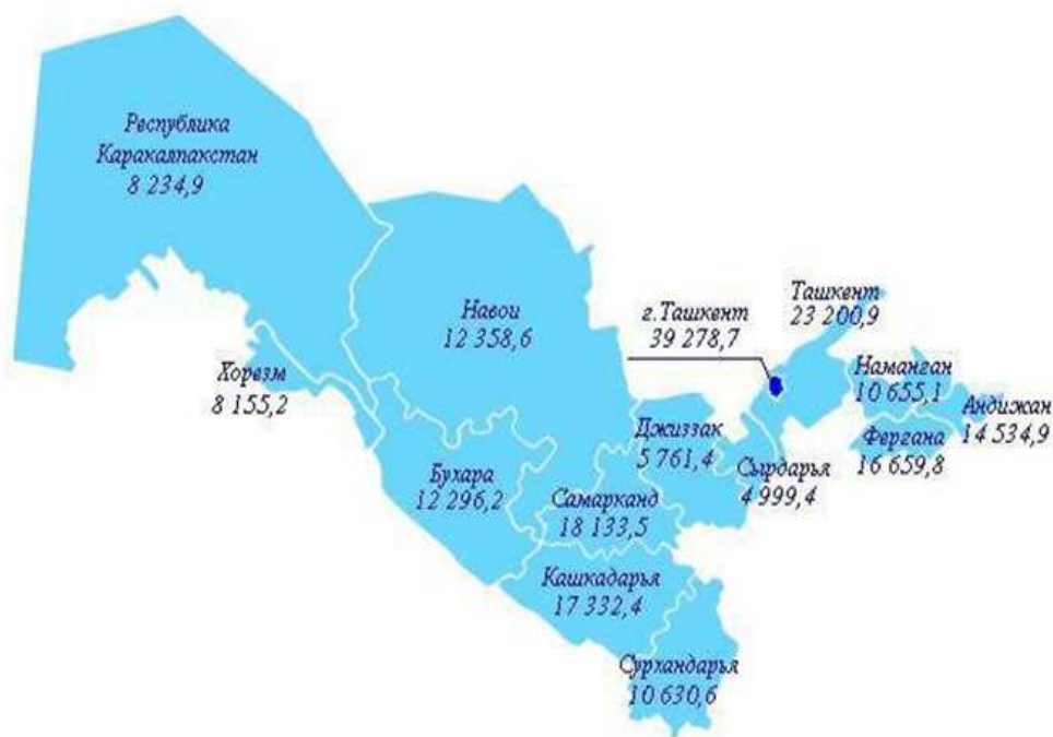
Рисунок 1. – Валовой региональный продукт за 2017 год, млрд сум [2]