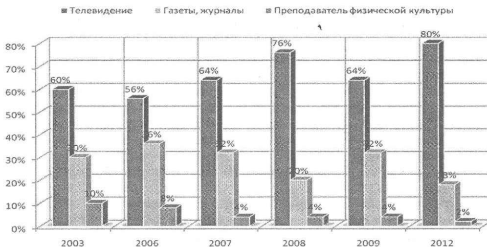
Рис. 1. Динамика ответов респондентов по годам опроса

Результаты исследования и их обсуждение. Анализ полученных анкетных данных показывает (рис. 1), что ответы респондентов (по годам исследования) отличаются друг от друга незначительно. Мощным средством пропаганды спорта, формирования общественного мнения об олимпийском движении является телевидение, особенно это было заметно в период проведения Олимпийских игр 2008 года в Пекине (источник выбрало 76 % респондентов) и 2012 года в Лондоне (источник выбрало 80 % респондентов).