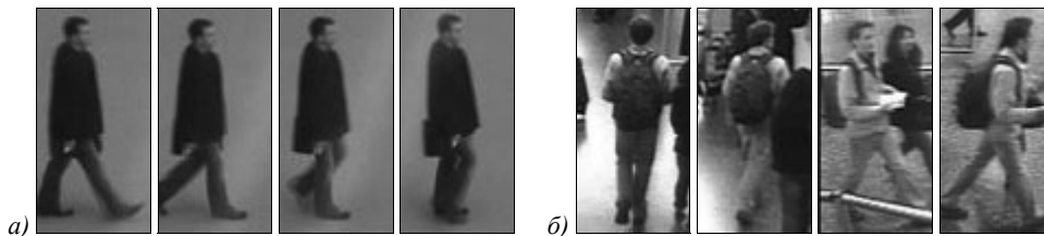
Рис. 2. Изображения из базы данных для обучения СНС: движущийся человек на однородном фоне в профиль из PRID (а); движущийся человек на сложном фоне с изменяющимся положением относительно видеокамеры из iLIDS (б)

Модифицированная СНС обучена на комплексной базе данных из наборов изображений PRID [20] и