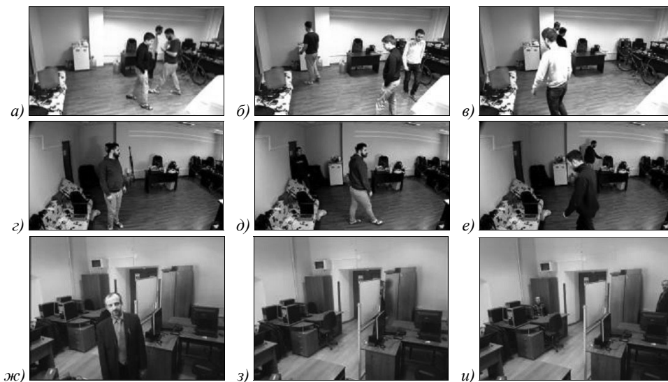
Рис. 3. Примеры кадров видеопоследовательностей, которые использованы при тестировании: кадры из первого видеоряда (а–в); кадры из второго видео (г–е); кадры из третьей видеопоследовательности (ж–и)

ным перекрытием (рис. 3е). Цветовые характеристики этих объектов интереса также достаточно схожи.