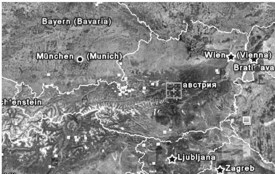
Рис. 2. Карта Австрии

Рассмотрим государство Австрия, показанное на рисунке 2.