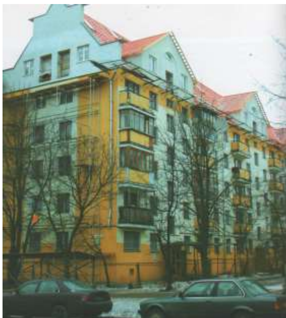
Рис. 1. Мансарда жилого дома в г. Минске

В Республике Беларусь совместная белорусско-английская компания ООО «Каркасные строительные технологии» (г. Минск) начала производство различных типов деревянных конструкций с применением МЗП для устройства покрытий мансард реконструируемых и вновь строящихся зданий. Компания применяет для производства конструкций высокопроизводительное североамериканское оборудование.