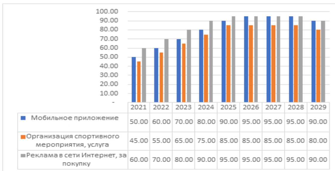
Рисунок 3. – Загрузка производственных мощностей, %

личности. Систематическое применение средств физической культуры расширяет возможности организма. Тренированный организм более устойчив к гипоксии, гипокинезии, резко меняющимся погодным условиям, действию стрессовых факторов и др. Физиологической основой влияния физической активности на организм человека являются моторно-висцеральные рефлексы (висцеральный от латинского viscera внутренний, относящийся к внутренним органам). Возникающие в работающих мышцах нервные импульсы активизируют деятельность органов и функциональных систем. Систематический их поток положительно сказывается на развитии и функциях мозга, состоянии вегетативной нервной системы, совершенствует деятельность кровеносной, дыхательной, пищеварительной и других систем организма. В результате, возрастает (до определенных пределов) способность к выполнению не только физической, но и умственной работы. Причем тренированный организм обладает не только большими резервами, но и более экономно и полно может их использовать.