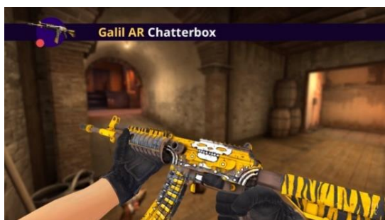
Рисунок 1. – Работа, содержащая череп

В соответствии с пунктом 6.В. Соглашения [9]: «Независимо от лицензии, описанные в Пункте 6.А., компания Valve вправе только модифицировать или выполнять производные работы на основе Вашего Переданного в мастерскую продукта в следующих случаях: (а) Valve имеет право внести изменения, необходимые для поддержки совместимости Вашего Переданного продукта с функционалом Steam или Мастерской или пользовательского интерфейса и (б) Valve или соответствующий разработчик имеют право вносить изменения в Переданные в Мастерскую продукты, утвержденные для распространения в составе приложений, поскольку те признаны необходимыми или рекомендованными для усовершенствования игр». То есть, перерисовка работ может осуществляться как компанией Valve, так и автором произведения, что в дальнейшем и было подтверждено ответами, полученными непосредственно от Steam support: «Если работа автора выбирается для кейса, мы обращаемся к нему в частном порядке и просим изменить оригинал для создания версии с более низким уровнем насилия», и EGO DEATH – создателя скина Chatterbox для Galil, который содержит изображение черепа в районе затвора. Работы EGO DEATH до и после перерисовки представлены на рисунках 1 и 2 соответственно.