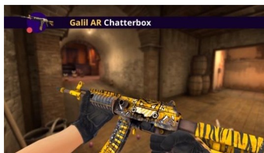
Рисунок 2. – Работа без черепа

Данные положения соответствуют установленным обязательствам, вытекающим перед компанией Valve из международных соглашений и конвенций в сфере интеллектуальной собственности: Всемирной конвенции об авторском праве (подписана в Женеве 6 сентября 1952 г., пересмотрена в Париже 24 июля 1971 г.), Договора по авторскому праву (Женева, 20 декабря 1996 г.) и т.п.