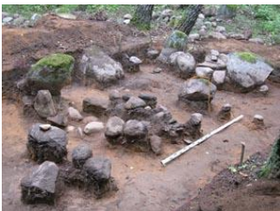
Мал. 1. Могілка каля в. Івесь Глыбоцкага раёна Віцебскай вобл. Каменныя надмагіллі пад слоem дзёрану. Раскопкі аўтара, 2015 г.

Пахаванні на большасці вядомых нам сельскіх могілак Беларускага Падзвіння XIV–XVIII стст. абазначаны каменнымі канструкцыямі (мал. 1). Магілы на іх маркіраваны валуннымі вымасткамі, абкладкамі, асобнымі буйнымі камянямі, каменнымі крыжамі [1, с. 125–127].