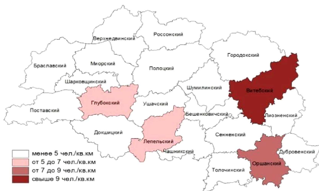
Рисунок 1. – Прогноз изменения заселенности сельских территорий Витебской области, 2035 год

(5,5 чел./км 2 – в 1,3 раза). Исключение – Полоцкий район, где, как и в других северо-восточных районах региона, она будет ниже среднеобластного уровня (рис. 1).