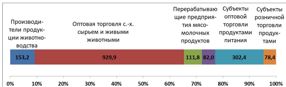
Рис. 2. – Валовая прибыль, смешанный доход хозяйственной деятельности на одного занятого по видам экономической деятельности субъектов рынка продукции животноводства в Украине за 2012-2018 годы, тыс. грн

Размер валовой прибыли, смешанного дохода (с учетом других налогов, за исключением других субсидий, связанных с производством) от хозяйственной деятельности предприятий-участников рынка продукции животноводства составляет 153 тыс. грн на одного занятого у сельхозпроизводителей (или 88% среднего уровня по экономике страны) 302 тыс. грн и 930 тыс. грн, соответственно, у представителей оптовой торговли продуктами питания и оптовой торговли сельхоз сырьём и живыми животными (175% и 538% уровня страны); от 82 до 112 тыс. грн в перерабатывающих предприятиях пищевой промышленности (47% и 65% уровня страны) и 78 тыс. грн у субъектов розничной торговли (или 45% уровня страны) (рис. 2).