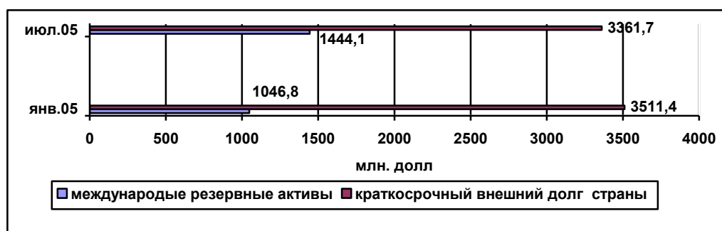
Рис. 2. Международные резервные активы и краткосрочный внешний долг Республики Беларусь в 2005 году