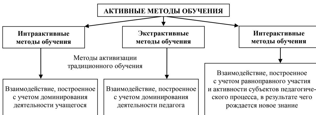
Рис. 2. Активные методы обучения в зависимости от сущности педагогического взаимодействия

Методы, которые реализуют установку на большую активность субъекта в учебном процессе, в противоположность так называемым традиционным подходам, где учащийся играет гораздо более пассивную роль, называют активными методами обучения. Называние этих методов активными не совсем корректно и весьма условно, поскольку, пассивных методов обучения в принципе не существует. Любое обучение предполагает определенную степень активности со стороны субъекта, которая согласована с деятельностью педагога, т.е. одновременно предполагается и взаимодействие между педагогом и учащимися. Без этого обучение вообще невозможно. Но степень этой активности неодинакова. Рассматривая сущность «информационного взаимодействия», В.В. Гузев выделяет три варианта распределения информационных потоков, определяющих роль активности учащихся в процессе обучения: интраактивный, экстраактивный и интерактивный режим [10]. В соответствии с этим можно выделить соответствующие методы активного обучения: методы активизации традиционного обучения (интра- и экстраактивные методы обучения) и интерактивные методы обучения. На рисунке 2 представлена схема, иллюстрирующая характер активных методов обучения в зависимости от сущности педагогического взаимодействия.