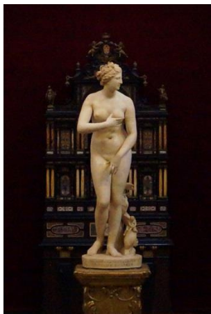
Рисунок 4. – Венера Медицейская

гинь, изображали их в молодом либо зрелом возрасте, при этом, не обращаясь к образам стариков и пожилых дам. Образы Богинь наделялись, благодаря такой трактовке, вечной молодостью, которая читается в чертах их лиц и формах бюстов. Примером таких образов могут служить скульптуры: Венеры Капитолийской, Венеры Медицейской (рис. 4), Фединты, Паллады (рис. 5), Юноны [5, с. 124]. Образы богинь являются идеализированными, их отличает особая осанка и статность.