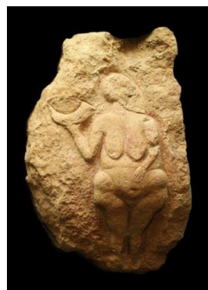
Рисунок 3. – Барельеф Венеры Лоссельской

В перечисленных выше примерах, отображения женского тела, имеют ромбовидную форму с ярко выраженными и гиперболизированными чертами бедер, груди, ног, живота. В объёмной фигуре с широкими бедрами, наливной грудью и сравнительно небольшой головой, не имеющей никакой портретной характеристики, сделан упор на физиологические части женского тела, тем самым подчеркнута значимость функции дето-