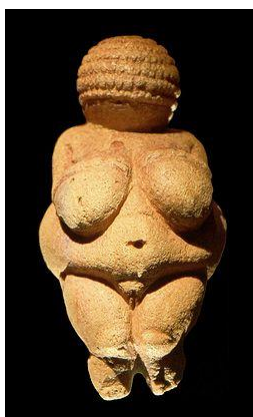
Рисунок 1. – Виллендорфская Венера

В искусство первобытного мира является отражением традиций и обычаев данного периода. Вардеман Е. отмечает, что для первобытного общества и его культуры характерно представление фигур женщин, в небольших глиняных статуэтках, именуемых божествами, которые воплощались в женском облике [3, с. 14]. Глиняные фигурки демонстрируют значимость детородной функции женщин, так как они представлены с гиперболизированными формами бедер и груди. Женский образ сопоставляется с образом матери – всеобъемлющей, сохраняющей и кормящей, предстающей в образе земного человека. Одним из ярчайших примеров, выступают фигурки Виллендорфских Венер (Палеолитических Венер) (рис. 1). В данную группу стоит отнести и такие находки как Венера из Холе-Фельс (рис. 2), барельеф Венеры Лоссельской (рис. 3) и другие изображения и скульптуры женщины, относящиеся к данному временному периоду.