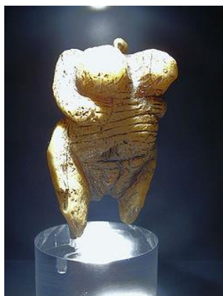
Рисунок 2. – Венера из Холе-Фельс