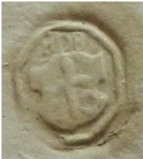
Малюнак 1. – Пячатка Багдана Друцкага Саколенскага.

Форма і змест дакумента. У складзе адзінак захоўвання НГАБ з былога Нясвіжскага архіва Радзівілаў знаходзіцца стракаты па змесце рукапісны зборнік, які ўтрымлівае шэраг матэрыялаў, датычных мінулага Полаччыны. Сярод іх апынуўся невялікі, фактычна на двух аркушах, дакумент, напісаны на польскай мове. Ён уяўляе сабой ненатарыяльнае грашовае абавязацельства Багдана і Гальшкі Друцкіх Саколенскіх, засведчанае іх подпісам, пячаткай Багдана, а таксама подпісамі і пячаткамі трох сведкаў [1].