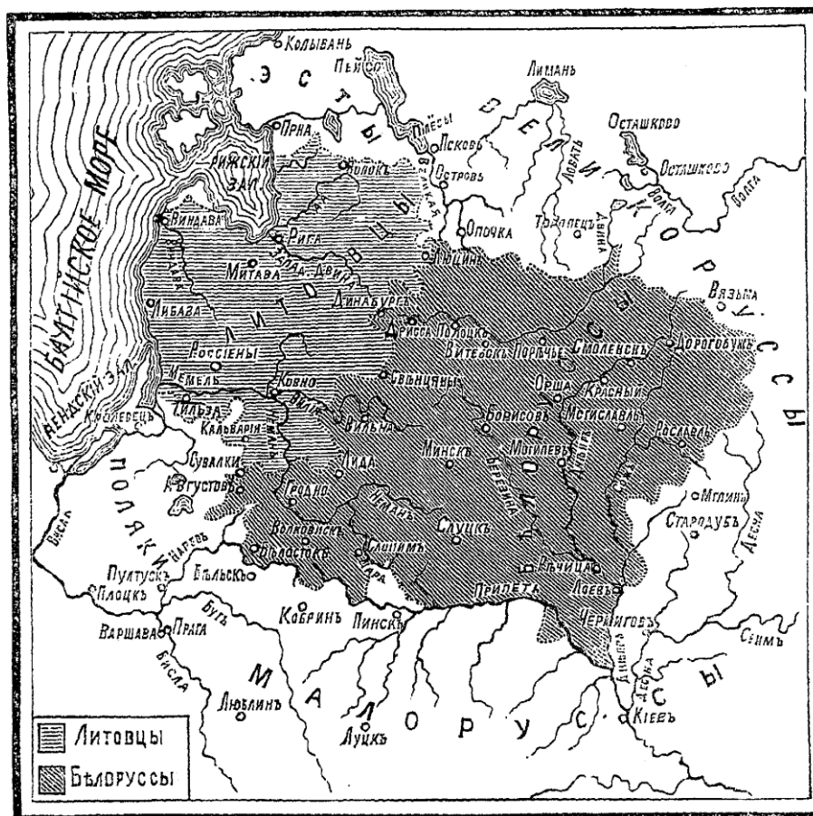
Малюнак 4. – Карта-схема Беларусі і Літвы паводле А.Ф. Рыціха, 1885 г.