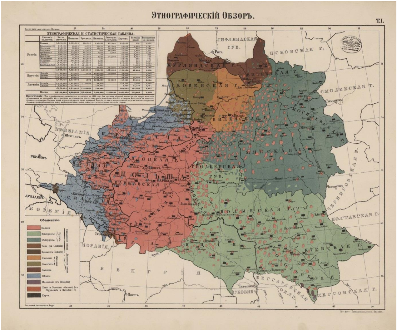
Малонак 2. – Этнаграфічная карта заходніх губерній Расіі, складзеная Р.Ф. Эркертам

ўласна літоўцаў (“литовцы в тесном смысле слова”) і латышоў (“резко отличающихся между собою и в настоящее время вероисповеданием, но еще более языком”). Падобна катэгорыі “рускіх”, літоўцы таксама былі падзелены “на две группы, довольно близкия друг другу: Литвинов и Самогитов или Жмудь, из которых последние, по своей образованности и цветущему состоянию, стоят гораздо выше первых” [8, Т. V]. Наконт розніцы паміж беларусамі і літоўцамі Р.Ф. Эркерт разважаў наступным чынам: “За исключением языка и совершенно особых, национальных и религиозных понятий, относящихся к отдаленному прошедшему, Литвины по своему внешнему образу жизни мало отличаются от смежных с ними Белоруссов, к которым они находятся в каком-то пассивном и подчиненном положении” [10, с. 69]. Такое бачанне (невывразнай) этнакультурнай адрознасці беларусаў і літоўцаў было наглядна праілюстравана і на этнаграфічнай карце: тэрытарыяльная мяжа паміж імі невыразная, нюансаваная, размытая, выглядае як стракатая мазаіка анклаваў беларускага, польскага і літоўскага насельніцтва.