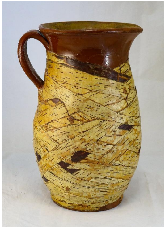
Малюнак 2. – Збан HD 131