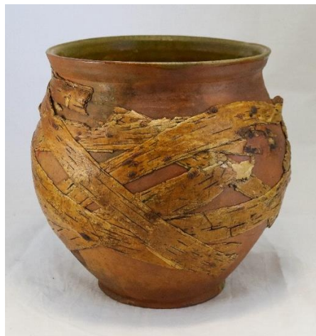
Малюнак 3. – Макацёр HD 213