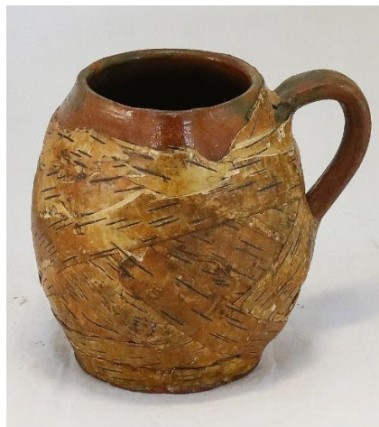
Малюнак 4. – Смятаннік KP 403