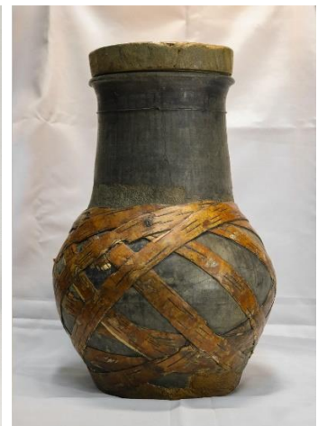
Малюнак 5. – Маслабойка KP 12885a6