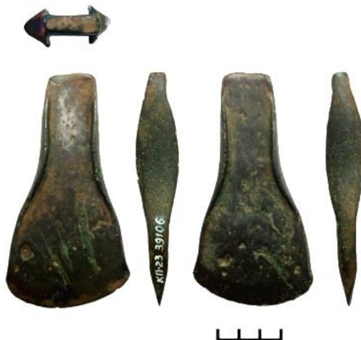
Малюнак 1. – Металічная сякера з Полацка

У ліпені 2017 года ад наваполацкага рупліўцы Міхаіла Варанько ў Полацкі краязнаўчы музей (філіял Нацыянальнага Полацкага гісторыка-культурнага музея-запаведніка) паступіла металічная сякера (мал. 1). Выраб належыць да катэгорыі сякер з закраінамі. Гэтая сякера з'яўляецца адзіным металічным вырабам эпохі бронзы са збораў музея 3 . Па прычыне адсутнасці ў музеі дакладнай пісьмовай інфармацыі аўтару не ўдалося высвятліць усе акалічнасці і абставіны выяўлення сякеры. Вядома толькі (паводле вусных звестак супрацоўнікаў музея), што артэфакт знайшлі прыблізна ў 20 км на паўднёвы захад ад Полацку, на полі, якое знаходзіцца на поўдзень ад вёскі Залессе Ветрынскага с/с і на поўнач ад шашы Р45 Вільня – Полацк (мал. 2). Тэрыторыя адосіцца да басейну ракі Шчабірка (правы прыток ракі Нача), што ў левабярэжжы Заходняй Дзвіны.