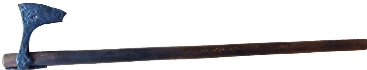
Рисунок 2. – Боевой топор из Полоцка. Реконструкция внешнего вида с топорщиком

Изделие подверглось ингибированию 5% спиртовым раствором танина и консервации 5% раствором Паралоида Б72 на ксилоле. После просушки при помощи мастики (30% раствор Паралоида Б72 и художественные пигменты) были восстановлены утраченная щековина и дефекты лезвия. Для выравнивания тона топор был покрыт восковой композицией с добавлением художественного пигмента (рис. 1, б)). Чтобы предмет обрёл завершенный экспозиционный вид, для него по образцам аналогичных археологических находок была выточена рукоять (рис. 2).