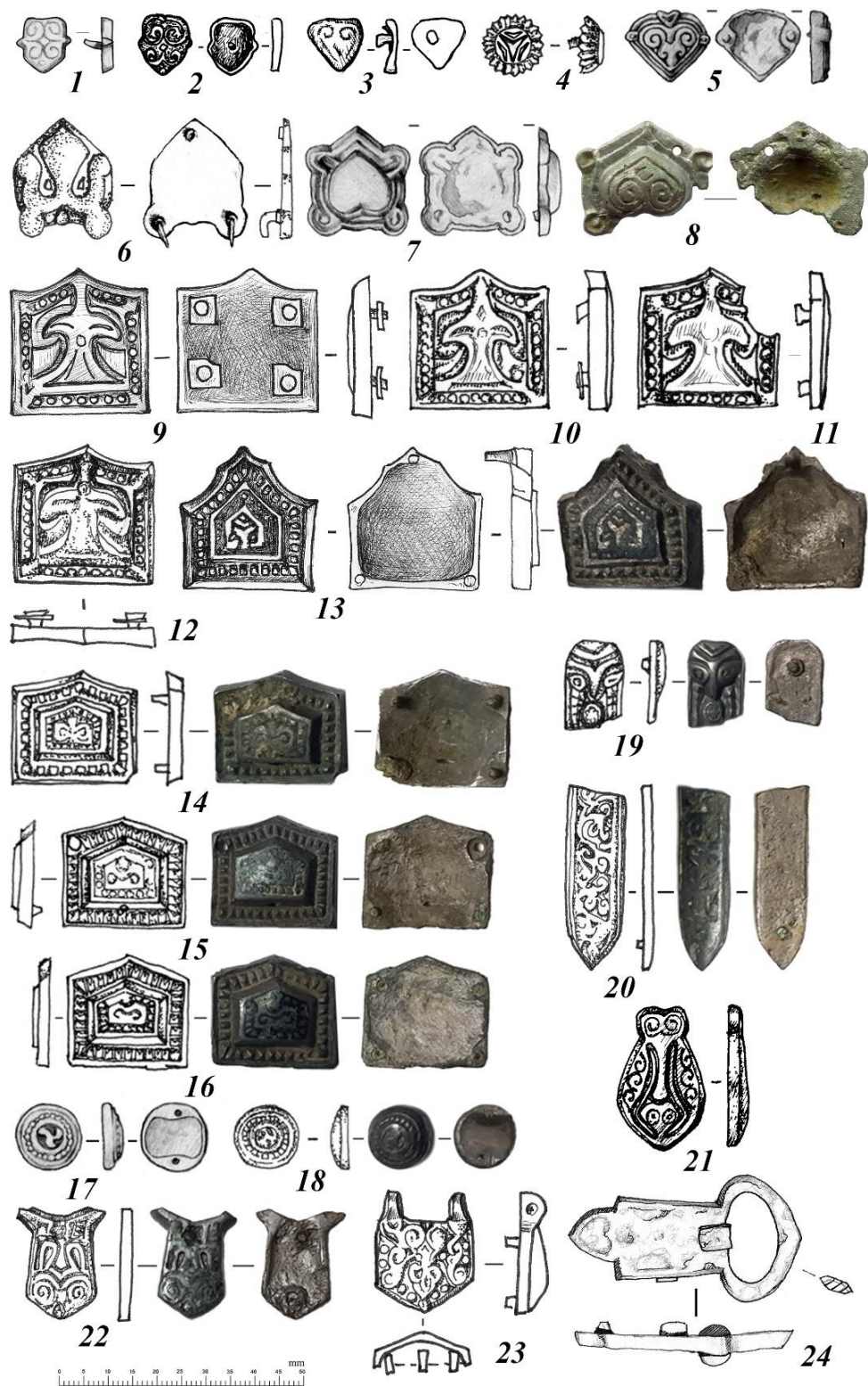
Рисунок 2. – 1-18 – поясные накладки, 19-21 – ременные наконечники, 22-24 – пряжки. 1 – Полоцк, 2,3 – Лучно, 4,6,9-13,18,21,24 – Гольшаны, 5,7,17 – Новые Волосовичи, 8 – Аксаковщина, 14 – Орша, 15,16 – Якуты, 19 – Воронь, 20 – Кацевичи, 22 – Ревятичи, 23 – Михиничи.

Лировидная пряжка поврежденная огнём (рис. 2: 24) найдена на городище Гольшаны [9, с. 28, рис. 3: 11]. Датируется XII–XIII вв.