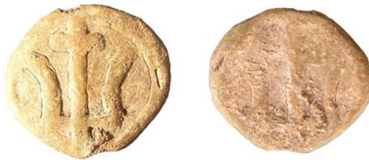
Рисунок 8. – Печать с изображением трезубца

Княжеская тамга представлена трезубцем, с раздвинутыми в противоположные стороны боковыми зубцами соединёнными горизонтальной линией и вертикальным зубцом посередине, который наверху завершается ярко выраженным перекрестьем. Нижняя часть центрального элемента выходит за горизонтальное соединение боковых зубцов. Предположительная стратиграфическая дата полоцкого артефакта – XI – середина XII вв. [15, с. 16].