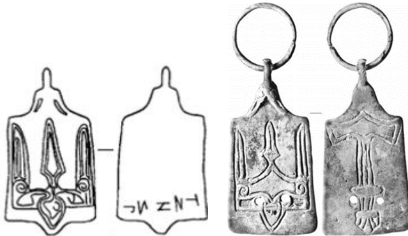
Рисунки 3–4. – Трапециевидные подвески с изображением трезубца

Помимо полоцкой находки и подвески из Передольского погоста, экземпляры с парадным изображением знака Владимира Святославича представлены на подвеске, обнаруженной в 1954 г. на Неревском раскопе Новгорода (рис. 3), подвеске из Рождественского могильника в Прикамье (рис. 4), подвеске из села Цыбли в окрестностях Переяславля Южного (рис. 5), двух подвесок с территории Украины (предположительно, Киева) [7, рис. 13]. Обратная сторона на данных артефактах оформлена изображениями не связанными с княжеским знаком: нечитаемой надписью выполненной рунообразными знаками на подвеске из Новгорода [8, с. 399–400], «мечемолота» или «молота Тора» на подвеске из Рождественского могильника [9, с. 37; 10, с. 22], неизвестного символа на подвеске из с. Цыбли [3, с. 268], изображением якоря на подвесках с территории Украины [7, с. 261–262, рис. 13].