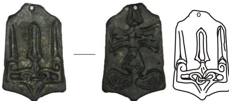
Рисунки 1–2. – Трапецевидные подвески с изображением трезубца

Первая гипотеза о назначении подвесок была сформулирована Б.А. Рыбаковым. Исследователь отметил сходство изображений с княжескими знаками на монетах Владимира и Ярослава и полагал, что подвески являлись верительными знаками представителей княжеской администрации [4, с. 238–240]. С выводом Б.А. Рыбакова согласился А.А. Молчанов, признав за подвесками Рюриковичей официальных представителей великокняжеской власти, выступающих с торговыми или дипломатическими миссиями [5, с. 80]. В.Я. Янин в свою очередь, предложил считать подвески знаками вирников – княжеских сборщиков налогов [6, с. 26–28]. Вслед за Б.А. Рыбаковым и А.А. Молчановым, С.В. Белецкий расценивает носителей подвесок как обладателей верительных знаков представителей княжеской администрации, выполняющих управленческие функции в месте пребывания [7, с. 250].