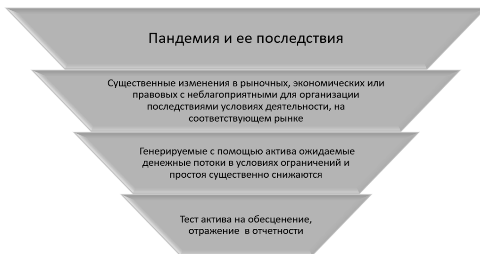
Рисунок 5. – Обесценение активов в условиях пандемии

Список позиций отчетности, требующих внимания и раскрытия дополнительной информации в условиях пандемии, достаточно объемный и включает, кроме перечисленных моментов, также оценку учета государственной безвозвратной помощи, которую можно учитывать по аналогии с кредитными ресурсами или грантами, кредитных убытков по финансовым активам (IFRS 9), формирование оценочных обязательств под обременительные контракты (IAS 37), оценку запасов (IAS 2), изменения по договорам аренды (IFRS 16) и целый ряд других статей.