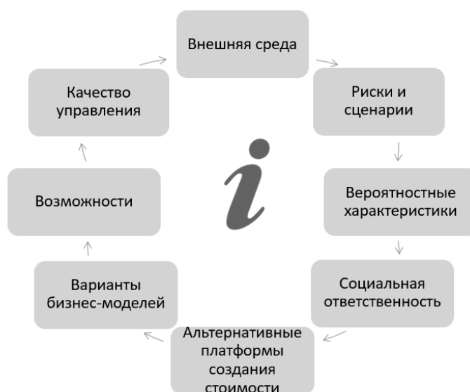
Рисунок 6. – Направления выделения объектов бухгалтерского учета: новое видение в контексте уроков пандемии