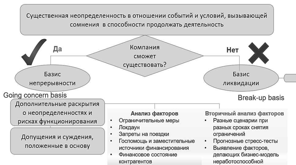
Рисунок 3. – Принцип продолжающейся деятельности (непрерывности) в условиях пандемии

Другим интересным аспектом является конкретизация исключительных «extraordinary», необычных «unusual», нечасто встречающихся «non recurring» статей отчетности. В действующей редакции МСФО между этими понятиями не проводится четкое разграничение, т.к. отсутствуют соответствующие дефиниции; в большей степени эти понятия рассматриваются в US GAAP, однако разница между ними является в большей степени субъективно определяемой, тем более что даже перевод на русский язык первых двух понятий практически идентичен. Если под экстраординарными, или исключительными статьями понимаются статьи (события) которые вряд ли повторятся в будущем, а под редкими, или нечасто встречающимися – те, которые могут повторяться с очень небольшой долей вероятности, то необычные статьи, по логике, должны занимать промежуточное положение между этими двумя понятиями по степени вероятности их возникновения. Понятно, что смысловая разница является достаточно трудноуловимой и требует четкого определения в стандартах. Тем не менее именно в условиях высокой неопределенности и риска, как в ситуации с пандемией, конкретизация такого рода статей является важной и требует четкой идентификации (рисунок 4).