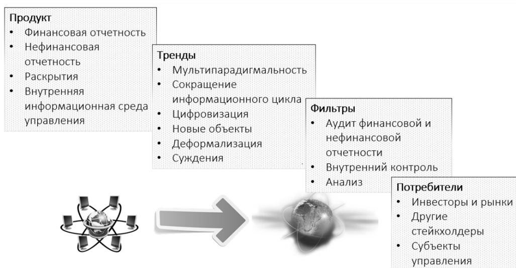
Рисунок 7. – Бухгалтерская информация в современных условиях