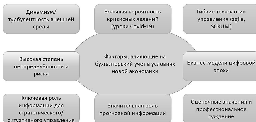
Рисунок 1 – Факторы, влияющие на бухгалтерский учет в современных условиях

Особенностью экономики «коронавирусной эпохи» является высокая степень ее зависимости от общего социально-экономического и политического ландшафта. События 2020 года показывают, что происходит разрыв цепочек создания добавленной стоимости и снижение возможностей глобальной кооперации, самоизоляция экономик. Неустойчивость демонстрирует тщательно выстраиваемая мировая финансово-экономическая архитектура, глобализация сменяется протекционизмом, блоковым противостоянием, региональной автаркией, усиливаются ограничения и системы государственного контроля. При высоком уровне конкуренции и нестабильности социально-экономической среды в еще большей степени возрастают риски для бизнеса. В таких условиях информация, скорость реагирования на изменения среды и адаптивность бизнес-процессов становятся стратегическим ресурсом в управлении экономической деятельностью. Более того, сами процессы и модели управления меняются: сокращается цикл принятия решений при быстрых изменениях, инновации охватывают не только операционные, но и управленческие процессы, появляются гибкие адаптивные технологии управления на основе самоуправляемых межфункциональных команд (agile-технологии, холакратия), когда централизация функций менеджмента и иерархичность сменяется горизонтальными связями и сетевой структурой. Факторы, влияющие на бухгалтерский учет в современных условиях, представлены на рисунке 1.