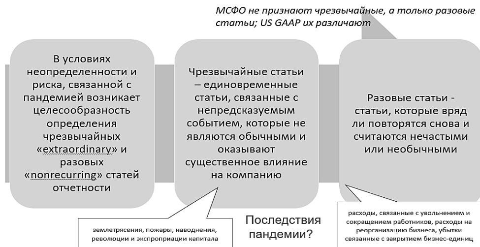
Рисунок 4. – Чрезвычайные и нечасто встречающиеся статьи отчетности: трактовки