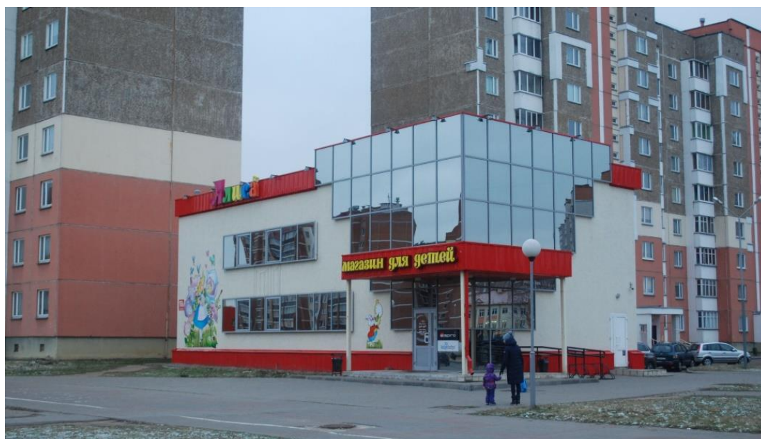
Рисунок 3. – Магазин «Алиса»

Заключение. Анализ объектов торговли на разных этапах развития Новополоцка, – города областного подчинения, показал, что архитектура общественных зданий, даже достаточно несложных объектов торговли, реализовывалась с учетом особого, повышенного внимания к ним, не позволяя ограничиваться обычной привязкой типовых решений. Торговые здания прежних лет строительства продолжают функционировать на своих местах, привычных постоянному покупателю. Поэтому не используются какие-то особо оригинальные архитектурные формы для привлечения посетителей, не делается укрупнение формата торговых зданий до супермаркета или гипермаркета. Архитектура торговых зданий Новополоцка содействует сохранению сложившейся масштабности городской застройки при одновременном использовании современных средств архитектурной выразительности.