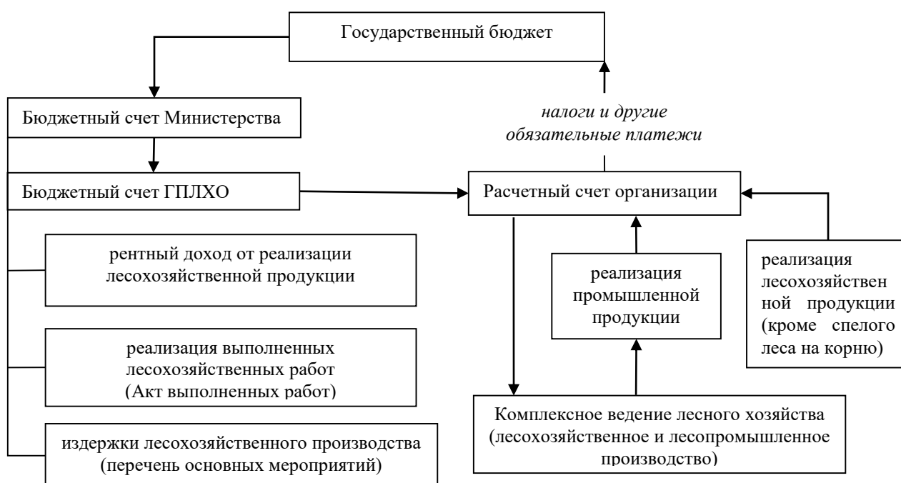
Рисунок 2. – Схема движения денежных средств и финансирования лесохозяйственных издержек комплексных лесохозяйственных организаций (лесхозов) в условиях коммерциализации их деятельности

Предлагаемая схема движения денежных средств и финансирования лесохозяйственных издержек комплексных лесохозяйственных организаций (лесхозов) в условиях коммерциализации их деятельности может быть представлена в следующем виде (рисунок 2).