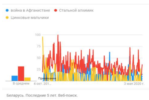
Малюнак 1. – Частотнасць пошуку названых паняццяў у Беларусі за 5 гадоў

У нашым выпадку цікавая частотнасць пошуку наступных пазіцый: «вайна ў Афганістане», «Цынкавыя хлопчыкі» і «Сталёвы алхімік» у рэгіёне «Беларусь» за апошнія 5 гадоў. У выніку запыту быў атрыманы наступны графік: