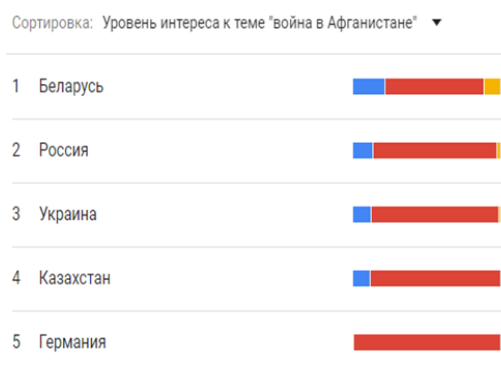
Малюнак 3. – Узровень цікавасці да тэмы «вайна ў Афганістане» па ўсім свеце за 5 гадоў. Топ-5 краін

Безумоўна, падобная сістэма аналізу не дае нам падстаў рабіць ўсеабдымныя высновы наконт прычын узнікнення «новых сэнсаў» літаратурнага твора ў сеткавай прасторы, але яна дазваляе наглядна ўявіць кірунак чытацкай актыўнасці ў асяроддзі аматараў сецэратуры, прычым не толькі ўнутры краіны, але і ў сусветнай супольнасці ў цэлым.