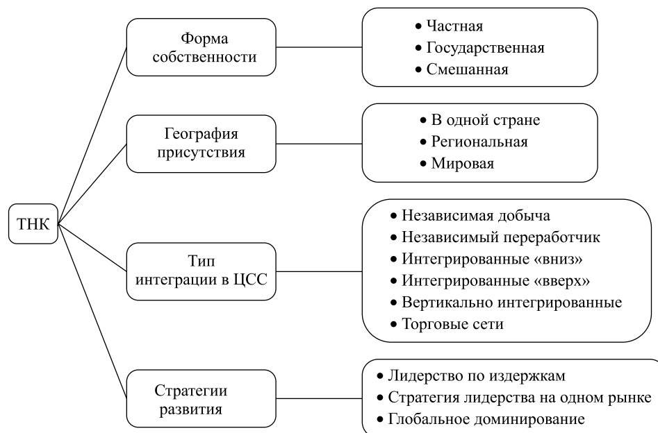
Рис. 1. Классификация ТНК

В целях исследования стратегий интеграции ЦСС систематизируем виды ТНК, выделенные на основе определенных критериев (рис. 1).