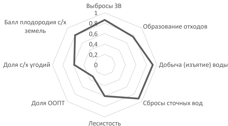
Рисунок 1. – Средние значения экологических показателей по Витебской области

Первоначальную тенденцию происходящих процессов определяли с помощью расчета средних значений нормированных экологических показателей (рисунок 1). Наиболее стабильный индекс с похожими значениями по районам характерен для двух показателей, связанных с изъятием воды из природных объектов и сбросом сточных вод. Максимальный разброс значений по районам характерен для групп показателей доли особо охраняемых территорий, доли сельскохозяйственных угодий и лесистости районов. Остальные показатели имели относительно равные значения.