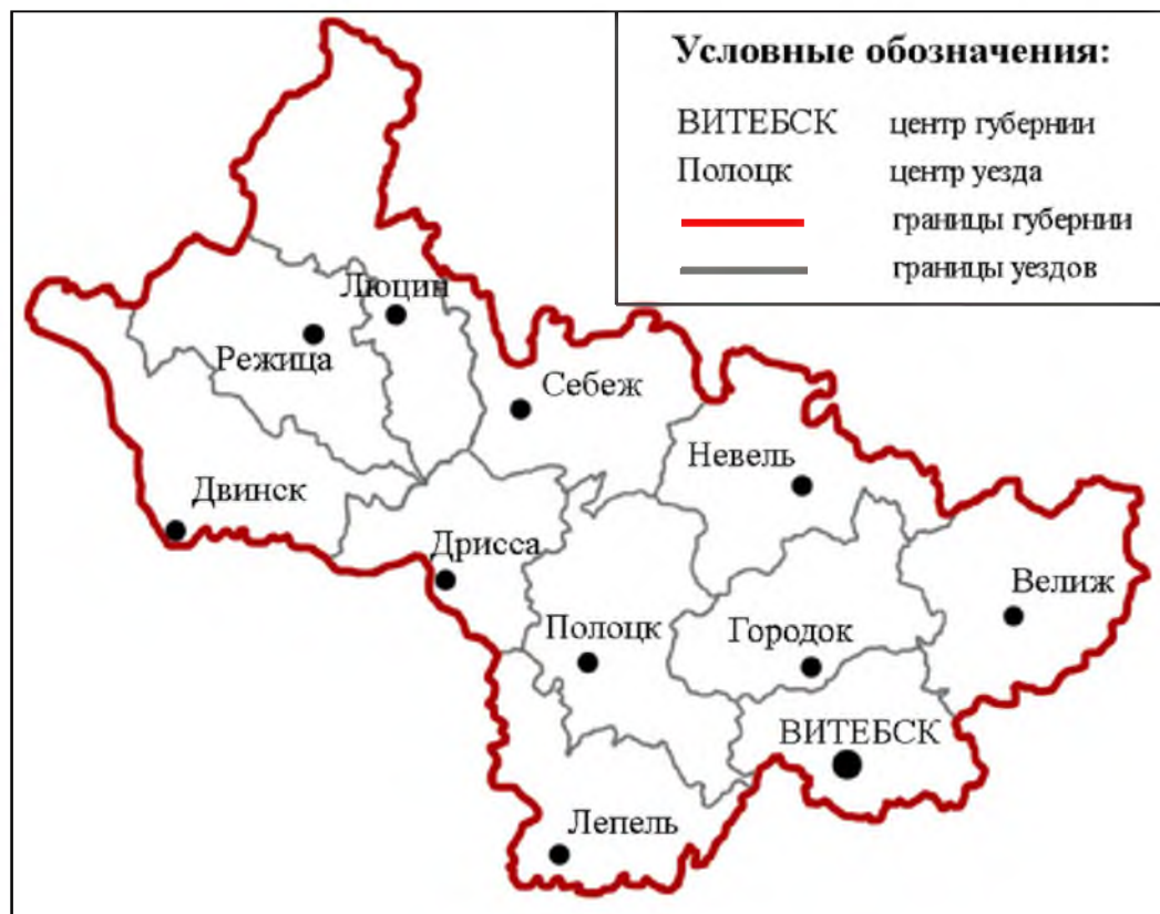
Рис. 1. Административно-территориальное деление Витебской губернии во второй половине XIX — начала XX в.

Цель данной статьи — выявить особенности расселения и проследить динамику численности старообрядцев Витебской губернии во второй половине XIX — начале XX в. Именно этот период характеризуется наличием достаточного количества статистических данных, которые позволяют достичь поставленной цели. По более ранним периодам такая информация фрагментарная и неполная. В качестве региона исследования выбрана территория Витебской губернии (рис. 1). Во второй половине XIX — начале XX в. этот регион являлся лидером среди западных губерний Российской империи по количеству старообрядческого населения.