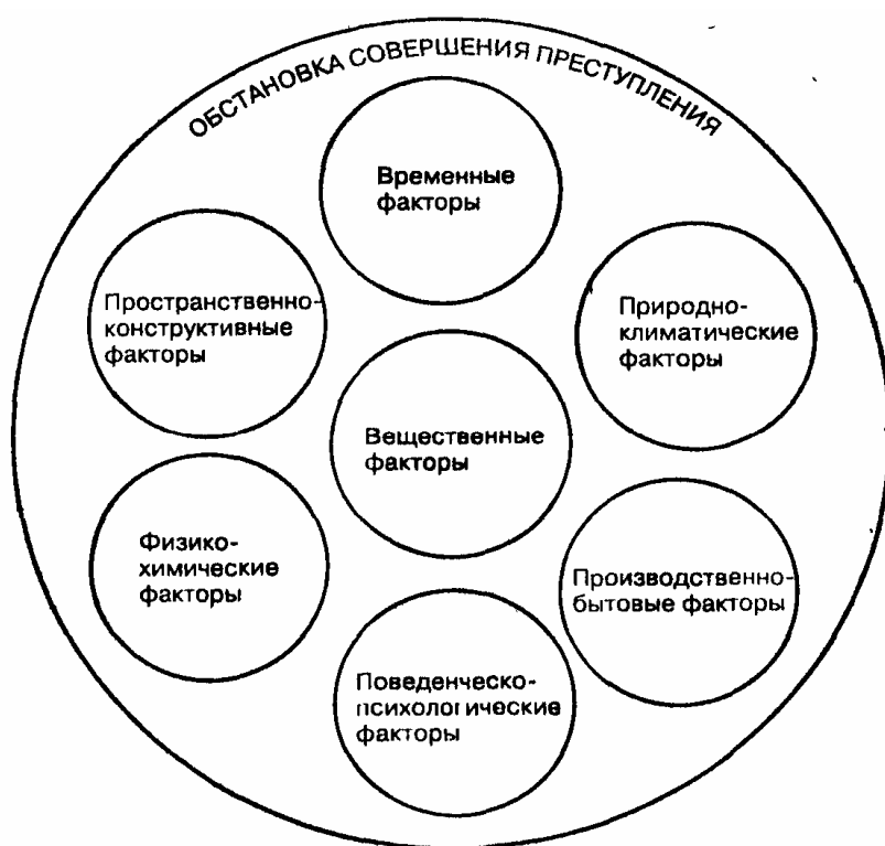
Рис. 2. Структура обстановки совершения преступления

Обстановка совершения преступления (криминалистический аспект) – система различного рода взаимодействующих между собой до и в момент преступления объектов, явлений и процессов, характеризующих место, время, вещественные, природно-климатические, производственные, бытовые и иные условия окружающей среды, особенности поведения не-прямых участников противоправного события, психологические связи между ними и другие факторы объективной реальности, определяющие возможность, условия и иные обстоятельства совершения преступления (рис. 2). Элементы обстановки оставляют различного рода собственные следы, которые могут быть выявлены при криминалистическом анализе преступления в процессе его расследования. Для ее уяснения большое значение имеет модальная информация из разных носителей и источников.