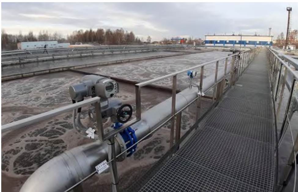
Рисунок 2. Аэротенки на очистных сооружениях г. Витебска

Денитрифицирующие бактерии при метаболизме вместо растворенного кислорода используют нитратный кислород. Так уменьшается количество нитратов, поступающих в анаэробную камеру с возвратным илом, и тем самым уменьшается их негативное влияние на удаление фосфора.